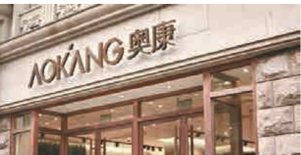
▲奧康國際斥資4.8億元控股蘭亭集勢

業內人士分析稱，伴隨政策鬆綁和制度改革的提速，未來特殊股權類企業回歸的數量有望不斷增加；同時，隨著註冊制的推出，回歸的中概股企業將會越來越多。蘭亭集勢是目前國內排名第一的外賣銷售網站，擁有來自世界各國的註冊客戶數千萬人，累計發貨目的地國家多達200個。