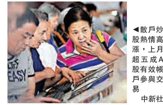
▲散戶炒股熱情高漲，上月超五成A股有效帳戶參與交易

5月日均新開A股帳戶數較上月有所減少。兩市日均新開A股帳戶59.40萬戶。其中，滬市平均每日新開A股帳戶數為33.69萬戶，環比減少5889戶，降幅為1.72%；深市平均每日新開A股帳戶數為25.71萬戶，環比減少14518戶，降幅為5.34%。