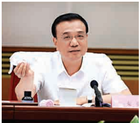
▲12日，李克強主持召開國家應對氣候變化及節能減排工作領導小組會議，研究提交《聯合國氣候變化框架公約》締約方會議的中國國家自主貢獻文件

李克強指出，必須堅持節約資源和保護環境基本國策，實施積極應對氣候變化國家戰略，研究制定長期低碳發展路線圖。必須堅持深化改革、創新驅動，通過大眾創業、萬眾創新，催生新技術、新產品、新模式，壯大節能環保產業，嚴控高耗能、高排放行業擴張，形成節能低碳的產業體系，培育新的增長點，推動經濟健康發展。必須大力實施「中國製造2025」，積極推進「互聯網+」行動，提升傳統產業和社會生活的智能化、綠色化水平。必須加大政府對生態環保等公共產品和基礎設施投入，探索政府與社會資本合作等投融資新機制。必須在對接全球綠色低碳需求中擴大國際產能合作，倒逼中國產業邁向中高端水平。