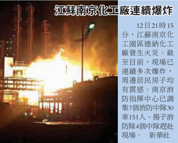
江蘇南京化工廠連續爆炸 12日21時15分，江蘇南京化工園德納德化工廠發生火災。截至目前，現場已連續多次爆炸，周邊居民房子均有震感。南京消防指揮中心已調集7個消防中隊30車151人、揚子消防隊4個中隊趕赴現場。 新華社

遇難者來自江蘇、上海、天津、重慶、安徽、福建、浙江、山東、陝西9個省市。事發後，湖北監利縣方面累計接待家屬2262人，目前已有1570餘人返鄉。目前，在監利的還有365名家屬和1664名工作人員。