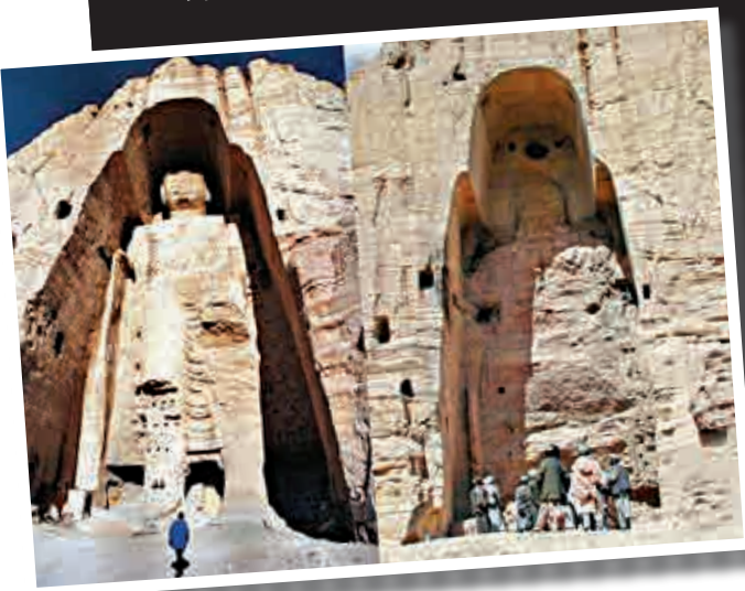
◀左圖是巴米揚大佛被毀前的資料照片。右圖是塔利班人員站在被徹底摧毀的巴米揚大佛前

雖然我不在現場，但是，看到這麼美麗的畫面我真的很激動。你們是在用行動告訴世界，中華民族是一個愛好和平的民族！也是在啟發動亂的中東地區回到和平中來！加油！