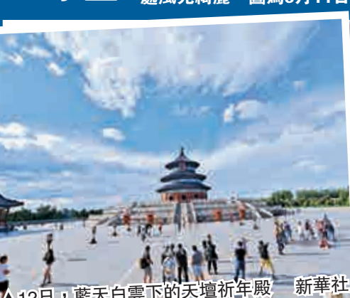
▲12日，藍天白雲下的天壇祈年殿

這幾天，送走了雷陣雨後的北京迎來晴天好天氣，藍天白雲下的京城處處風光綺麗，圖為6月11日傍晚的北京。