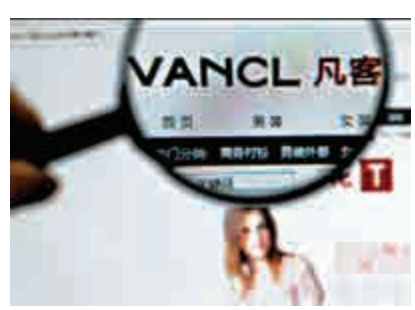
▲「神秘買家」將參與抽查網絡電商

根據質監部門確定的商品品種或商品範圍，在電商平台上購買商品，並送交質監部門檢測，期間不能透露採樣目的——30名「神秘買家」6月11日在杭州市國家電子商務產品質量風險監測處置中心領取聘書，正式上崗。杭州市質監部門透露，首批「神秘買家」預計6月下旬開展行動。