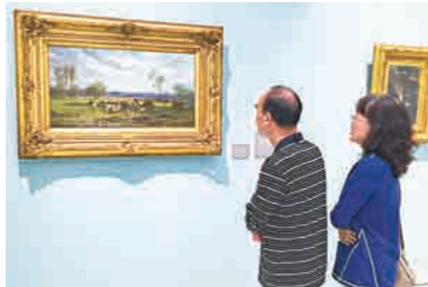
▲觀眾在觀看十九世紀法國現實主義油畫

正如蕭勤所說：「人生每個不同的階段一直都不停地在輪迴着，離開了這裡，還有另一處空間，像似一個圓般，那是一種非時間性、非物質性的境界。」該展覽在中環雪廠街16號西洋會所大廈8樓展至本月二十七日。