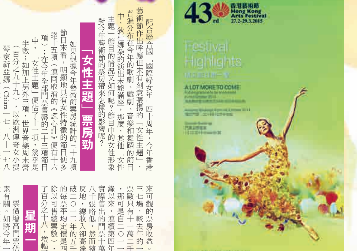
▲「精彩節目第一擊」封面用的是芭蕾舞劇《仙履奇緣》的造型照片 ▼《金蘭姊妹》場刊封面

在此一看似亮麗的成績單後面，不難看出節目策略處處都將票房收益放在前提考慮（採用相對「保險」的主流經典節目為主，自是必然之事）。香港藝術節年度預算中接近三成經費來自香港特區政府透過康樂及文化事務局的撥款，三成多經費來自贊助及捐款，餘下約四成經費便要依靠票房收入，比重可說極大，在政府撥款已連續五年未有增加的情況下，票房壓力必然一年較一年增大，這便難免會左右了節目策劃的方向，今年的「女性主題」能造就了高票房，來年可會將此主題再來一次呢？「女性主題」節目有足夠號召力的為數不少呢！