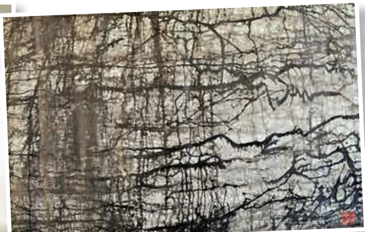
▲書法作品《墨韻》

是次展覽展期至七月二十一日。有關詳情可瀏覽藝術門網頁： http://www.pearllam.com/ 或致電：二五二一四二八查詢。