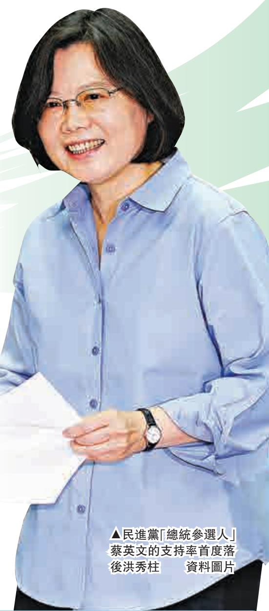
▲民進黨「總統參選人」蔡英文的支持率首度落後洪秀柱 資料圖片

交叉分析顯示，20-39歲年輕選民支持蔡英文比率較高，40歲以上選民則以洪秀柱較佔優勢。若以地域區分，中彰投以北，洪秀柱領先蔡英文；雲嘉南以南則是蔡英文佔優勢。