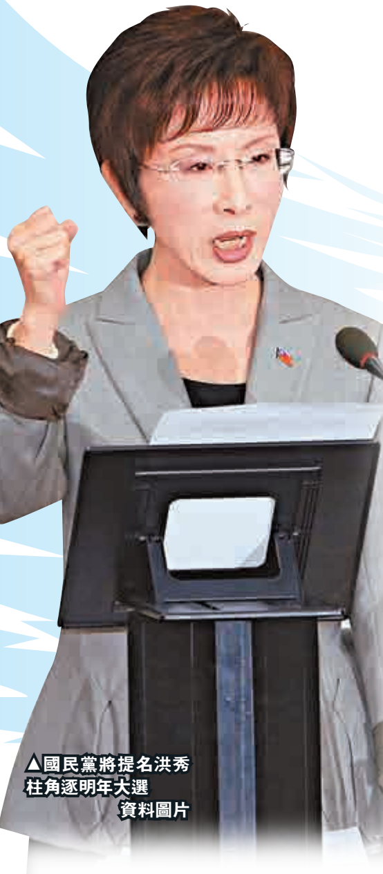
▲國民黨將提名洪秀柱角逐明年大選 資料圖片

至此，洪秀柱正式成為國民黨「總統」候選人的程序，只剩下最後一關，即提名建議案送交7月19日的全代會討論並公決。