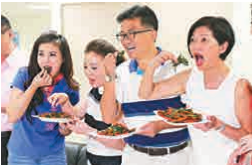
▲國民黨議員近日端出「小辣椒炒空心菜」，以示支持「小辣椒」洪秀柱 資料圖片

一位南部國民黨立委則說，洪秀柱當母雞有利有弊，洪最大幫助只有在國民黨跟蔡英文的攻防上，讓民進黨沒那麼春風得意。但是在傳統組織戰上，洪一點幫助都沒有，他同樣不會主動爭取洪來站台，「因為她在地方上誰都不認識，我還要幫她介紹，那是她來拉抬我，還是我拉抬她？」