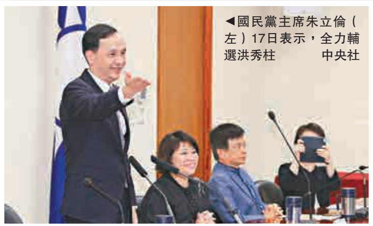
▲國民黨主席朱立倫（左）17日表示，全力輔選洪秀柱

由於洪秀柱過去問政風格嗆辣，現在可能被國民黨提名，嗆辣語錄再現，洪秀柱對此說，她要強調每個人在不同職場、不同環境的角色扮演很重要。很多女立委在「立法院」質詢很嚴苛、很兇、很犀利，「難不成她回家對先生，也在質詢嗎？質詢先生幾點回來嗎？不會嘛。」