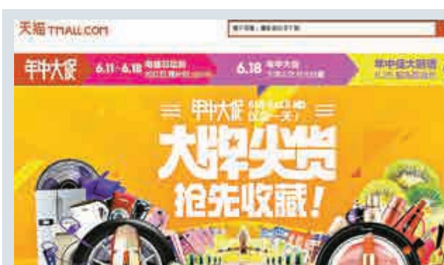
▲天貓年中大促，為消費者提供來自25個國家、30萬以上的進口商品 天貓官網

最新數據顯示，中國B2C（對商對）網絡零售市場之中，天貓佔59.3%排第一；京東佔20.2%排第二；蘇寧易購第三，但佔比僅3.1%。從去年六月十八日網購用戶在主流電商平台的瀏覽頁面數分布情況看，分別是京東頁面瀏覽數佔比從日常的10%左右，驟增到18.9%，唯品會從2.1%增加到3.4%，蘇寧從1%到1.8%，國美在線從0.3%增至0.6%。