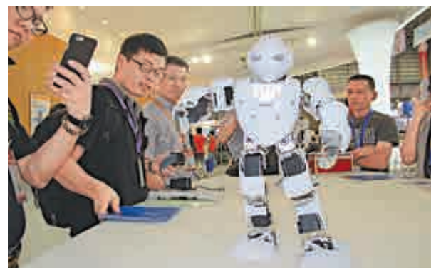
▲加博會展位一款「機器人」吸引不少採購商目光

秘書處還宣布明年將加博會提前至4月舉行。秘書處對此解釋稱，將加博會提前，是為了進一步推進加博會專業化、市場化的步伐，方便企業接單生產，提高採購對接實效。