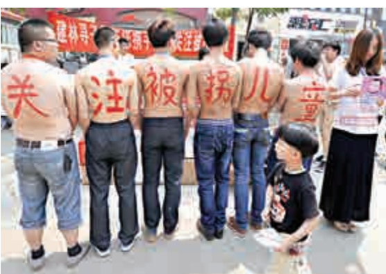
▲山西大學生街頭赤膊宣傳打拐

據統計，2010年至2014年，全國各級法院審結拐賣婦女、兒童案719宗，對12963名犯罪分子判處刑罰，其中判處5年以上有期徒刑至死刑的7336人，重刑率達56.59%。