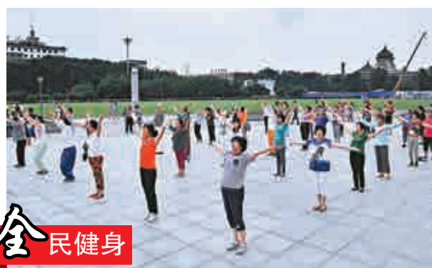
▲入夏以來，每當傍晚，都有許多長春市民來到春市文化廣場內跳廣場舞健身

《報告》預計，2015年，藥品流通行業銷售總額將保持穩定增長，企業兼併重組和上市步伐有望加快，現代信息技術的應用將促使行業進入全面轉型發展新階段。