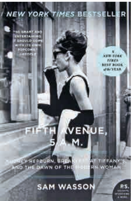
▲《Fifth avenue, 5A.M.》的作者是美國作家山姆·沃森

句酌的新聞聲明，旨在說服美國人，現實中的奧黛麗與劇中角色截然不同。他們解釋道，她不是一個妓女，她是一名「怪傑」（kook，超脫世俗價值觀的人）。妓女和怪傑是完全不一樣的。但無論他們如何解釋，派拉蒙還是沒能蒙蔽住所有的人。