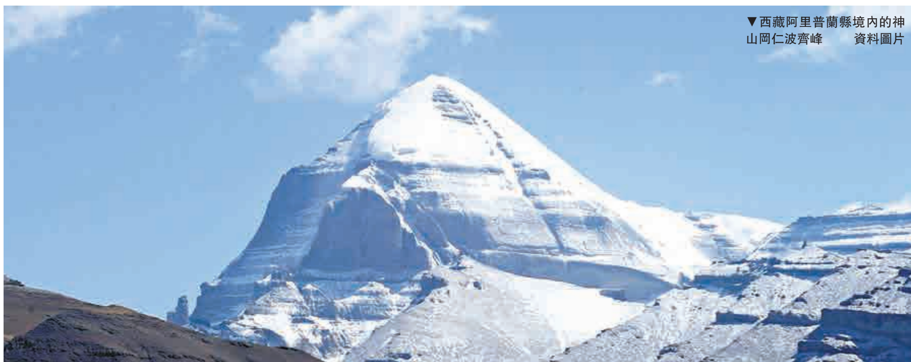
▼西藏阿里普蘭縣境內的神山岡仁波齊峰 資料圖片

董明俊說，中國政府和西藏自治區政府希望以此為契機，進一步推進與加強中印戰略互信，拓展各領域合作，深化人文交流，妥善處理有關分歧，促進共同發展，將雙邊關係提高到新歷史水平。