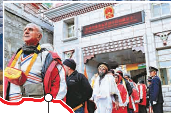
▲22日，印度香客通過新開放的中印邊境乃堆拉山口赴西藏神山朝聖