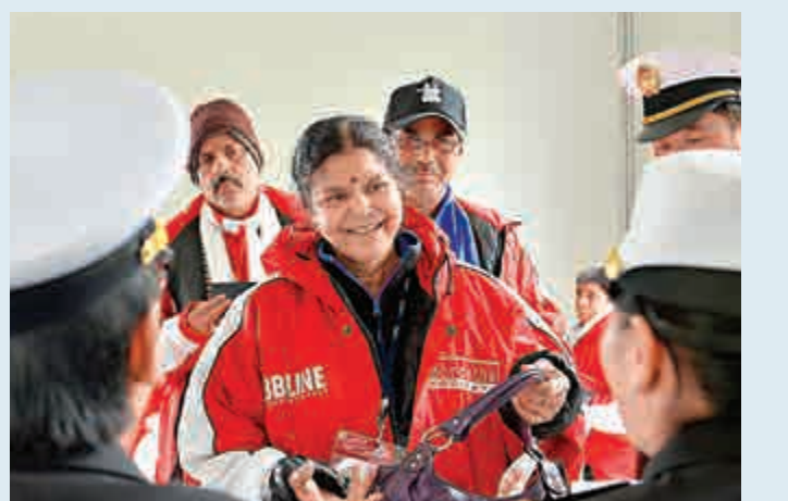
▲印度香客在接受中國海關查檢