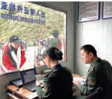
▲乃堆拉山口中方海關人員檢查印度香客的證件

許利平告訴大公報，去年9月習近平主席訪印後，兩國達成了重要共識。此次朝聖新線路的開通就是兩國共識化成了具體行動，因而體現了兩國高層間的政治互信，對兩國關係的改善與發展必將起到積極的推動作用。 許利平還說，現在困擾中印關係的主要障礙就是政治互信基礎不牢。而增進國家間政治互信的途徑有很多，首先就是要增進兩國人民的彼此了解。而朝聖新線路的開通正從一個側面體現了印度人民了解中國文化的需求以及對中國文化的認同。 自中國提出建設「一帶一路」的倡議以來，沿線各國紛紛積極響應。但作為中國西南地區最大鄰國且具有重要地緣戰略意義的印度卻始終未作明確表態，對此許利平認為，「一帶一路」的核心內涵就是政策溝通、設施聯通、貿易暢通、資金融通、民心相通這「五通」，此次開通朝聖新線路正有助於兩國民心相通，因此必將有助於中印在「一帶一路」建設中加強共商共建共享，進而推動「一帶一路」建設的推進。