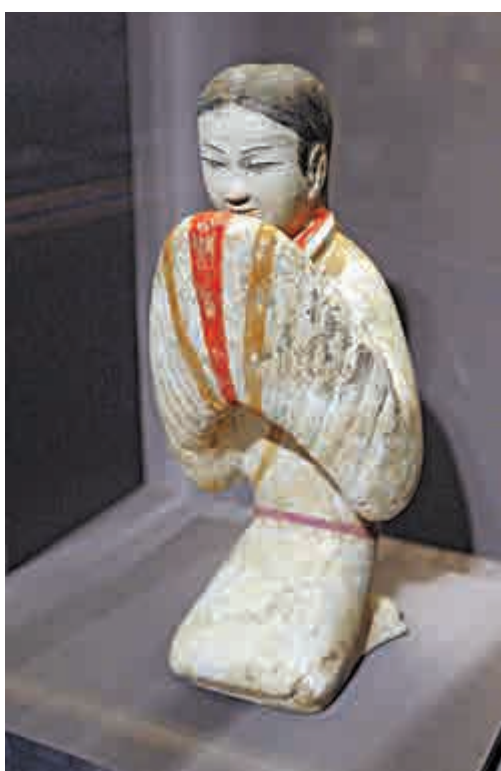
◀ 塑衣式彩繪跏坐拱手女俑

「漢武盛世：帝國的鞏固和對外交流」由即日起，在香港歷史博物館展至十月五日，詳細查詢可電：二七二四九〇四二。