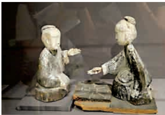
▲ 六博木俑 大公報記者劉毅攝