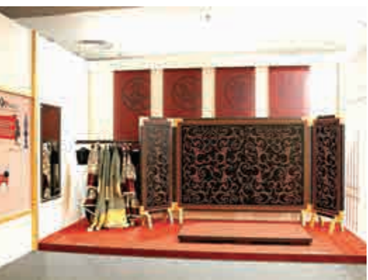
▲ 市民可來「漢服試身室」，穿上漢服，體現漢人的「含蓄」之美

如觀眾想穿越時空體會古人的禮儀之美，亦可前往展廳入口處設立的「漢服試身室」。該試身室仿效漢代家居而造，架上掛了六件根據漢代文物服飾製造的漢服和兩頂帽的複製品和鏡子，旁邊的布景板則圖文並茂地描述了漢朝的禮儀，再加上兩名導賞員的指導，讓大家來一場穿越時空，體現漢人「含蓄」之美。