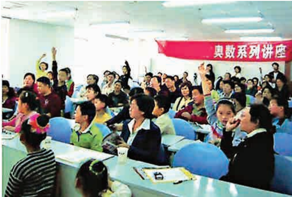
香港的奧數狂熱風氣低於內地