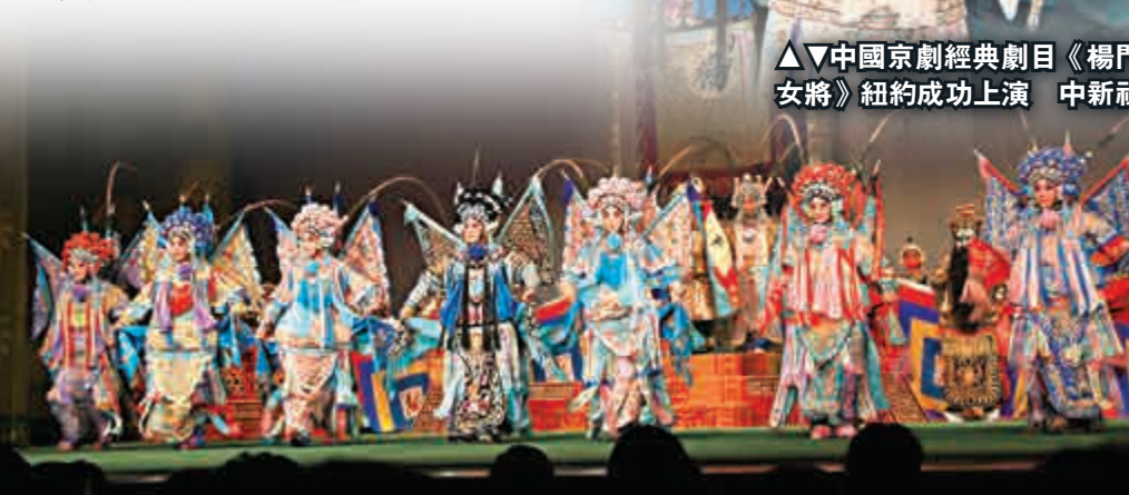
▲中國京劇經典劇目《楊門女將》紐約成功上演

除了蕩氣迴腸、宏偉壯觀的大戲，本次活動還專門安排了一場傳統經典京劇折子戲匯演，包括有折子戲《白蛇傳·遊湖》、《武松打店》、《鎖麟囊·春秋亭》，以及《智取威虎山》選段「打虎上山」、「八年前」、《捉放曹》選段「聽他言嚇得我心驚膽怕」、《釣金龜》選段「叫張義我的兒聽娘教訓」、《白毛女》選段「紫紅頭繩」等，通過多種形式的演繹，讓紐約觀眾充分領略中國國粹藝術的無窮魅力，將中華民族優秀的傳統文化廣為傳播，也將中華兒女的浩然正氣向世人展示。