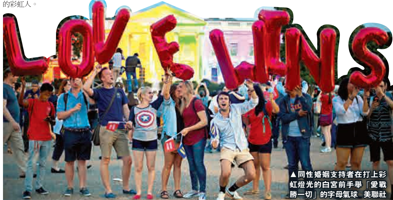
▲同性婚姻支持者在打上彩虹燈光的白宮前手舉「愛戰勝一切」的字母氣球

此外，谷歌亦有搞作，只需在搜尋欄打入「gay marriage」，搜尋頁左上方便會出現彩虹心，右上方則出現一排手牽手的彩虹人。