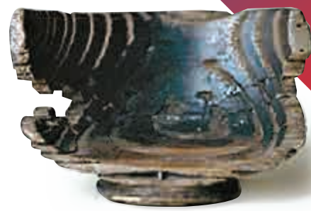
▲英國警方尋回的「聖杯」

【大公報訊】據英國《每日郵報》報道：一個極為珍貴的中世紀木製古杯，去年在英國失竊。事隔一年後，英國警方近日尋回這個古杯。有宗教人士指，這個古杯是耶穌在最後晚餐時曾使用過的「聖杯」。