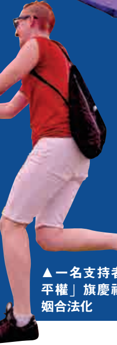
▲一名支持者手持「平權」旗慶祝同性婚姻合法化