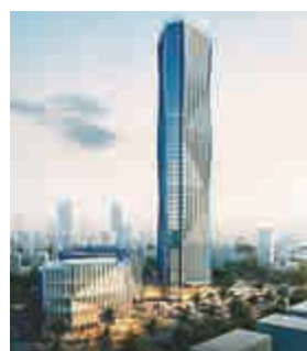
▲埃塞俄比亞商業銀行新總部大樓效果圖 網絡圖片

【大公報訊】由中國建築股份有限公司（中建公司）承建的埃塞俄比亞商業銀行新總部大樓奠基儀式27日在亞的斯亞貝巴舉行。這座46層、198米高的大樓將成為埃塞乃至東非地區的第一高樓。