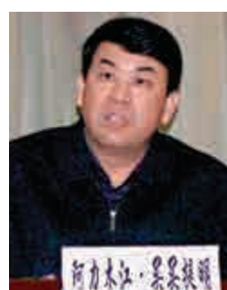
▲阿力木江·買買提明 網絡圖片

【大公報訊】據中新社烏魯木齊二十八日消息：新疆紀委監察廳網站發布消息稱，新疆維吾爾自治區人民政府黨組成員、秘書長、辦公廳黨組書記阿力木江·買買提明涉嫌嚴重違紀，目前正接受組織調查。