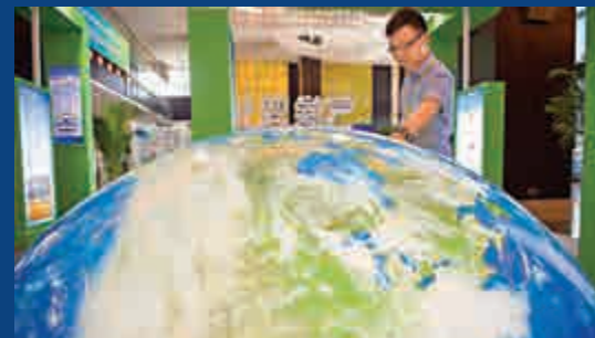
▲與會嘉賓在會場內參觀「氣候變化與可持續發展主題展」

開幕式上，中共中央書記處書記、全國政協副主席杜青林發表演講，本屆年會以走向生態文明新時代、新議程、新常態、新行動為主題，完全契合現實的需求和方向，凝聚了國際社會對生態文明建設的共同關注和歷史責任，具有十分重要的意義。