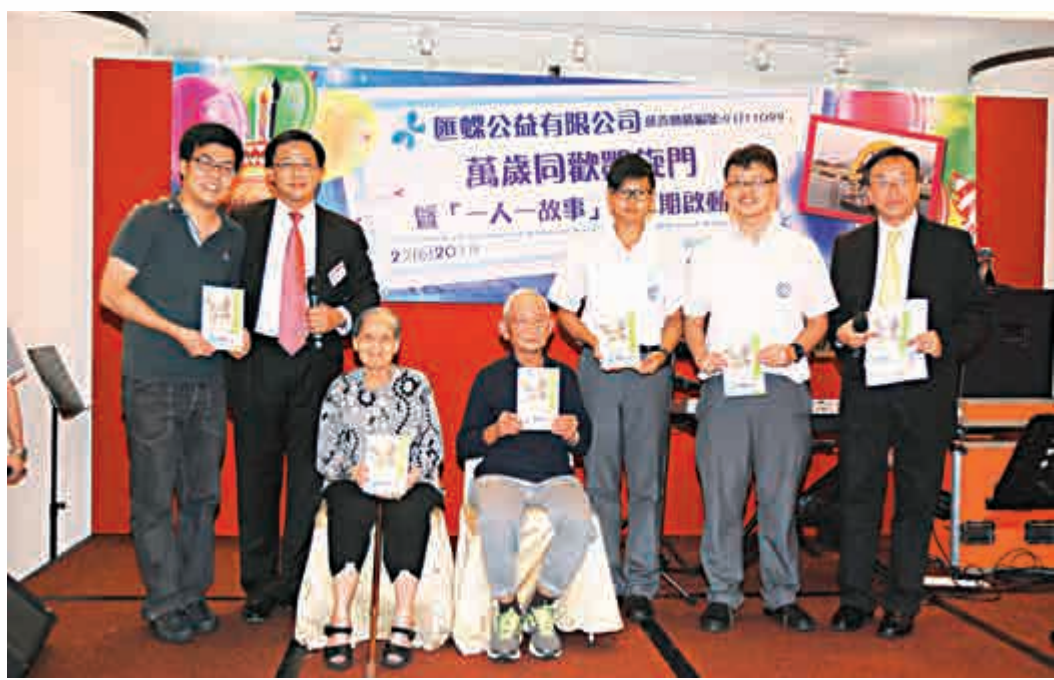
◀一人一故事，讓何福堂書院的學生親身感受老人家的生活和智慧

令我印象最深刻的是：一個老伯伯雖不擅言辭，但他原來為香港付出了很多。他犧牲了不少青春歲月（家庭相處的時間）才換取今天繁榮成功的香港，可他對此無怨無悔。現在他退了下來，他的兒女因工作的關係就把他送進老人院。他在老人院