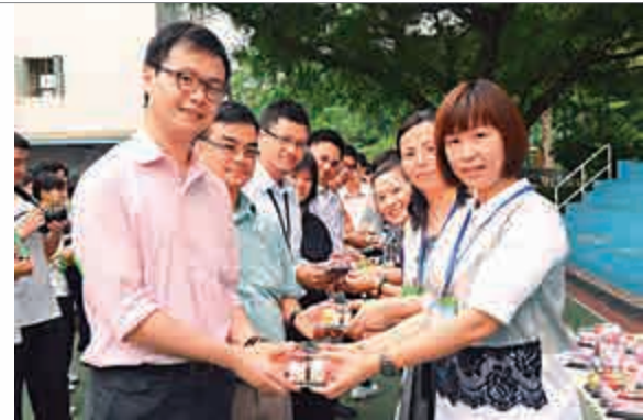
▲基新中學家長代表向每位老師送上小小心意

現今社會上面臨的問題可不就是這般？持着不同意見的人互不退讓的爭吵着，最終不但無法根治問題，反而惡化了人與人之間的關係，更會落得雙輸的局面，這又何苦呢？俗語有云：退一步海闊天空。學習聆聽別人的意見，比一味兒堅持自己的想法要高明得多了！