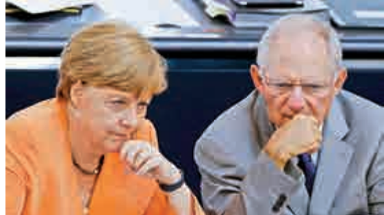
▲默克爾(左)和朔伊布勒(右)指出，希臘上一輪的援助談判已結束