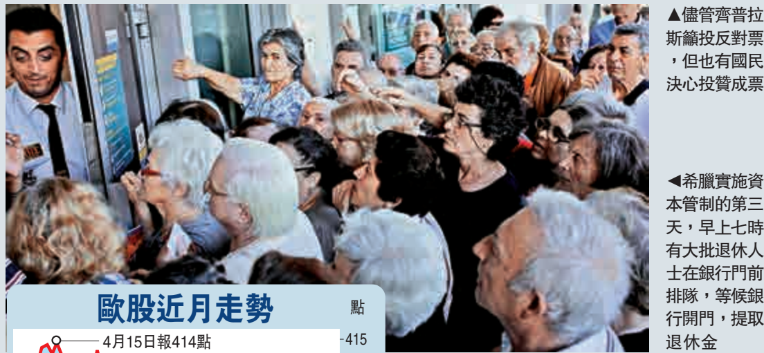
▲儘管齊普拉斯籲投反對票，但也有國民決心投贊成票 ▲希臘實施資本管制的第三天，早上七時有大批退休人士在銀行門前排隊，等候銀行開門，提取退休金