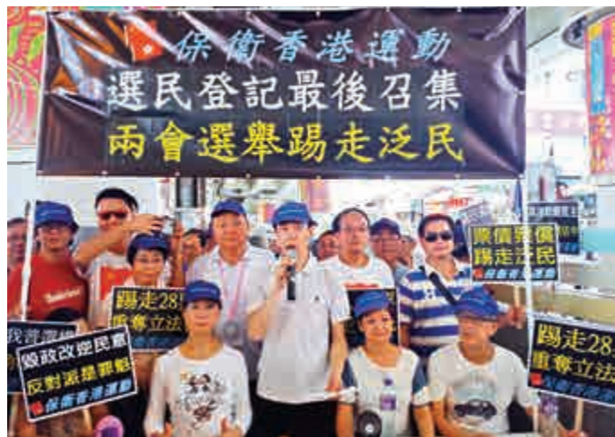
▲保衛香港運動昨日在灣仔鵝頸橋擺街站，呼籲市民把握昨天截止的選民登記

時間的爭論甚至部分人士的非理性行動，隨着政改方案被否決，爭論亦應告一段落。社會需要時間冷靜下來，放下爭拗，重新聚焦於急切的經濟和民生政策。特區政府會與社會各界共同努力，加強溝通，重建互信，同心協力推動香港的經濟發展，以及解決房屋、貧窮、老年社會和環境等的民生問題。」