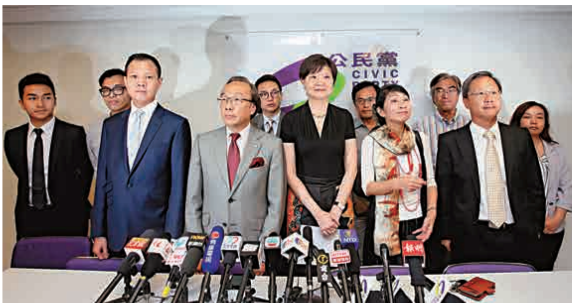
▲香港研究協會最新一輪民意調查顯示，大部分市民對各陣營政黨感到失望，當中以公民黨評分跌幅最大

對比上一輪的調查報告，公民黨錄得最大跌幅，跌0.16分至2.33分。香港研究協會分析指出，反對派否決政改方案，令港人在2017年普選行政長官的願望落空，導致得分普遍降低。至於建制陣營方面，研究協會認為，建制派議員在投票當日出現差錯，令支持政改的市民感到失望。香港政團整體表現的滿意度評分