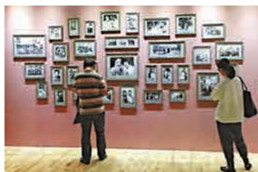
▲展廳入口的照片牆上，展示了張大千與親友的照片

雖然深得父親鍾愛，但因歷史原因，張心瑞與張大千也曾兩地相隔多年，即使是大師仙逝台灣，子女們也只能在香港隔海祭拜。如今談起這段往事仍不能不令人唏噓。而長期