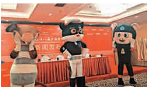
▲發布會上，影片三位主要動畫人物登場，令現場沸騰