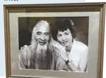
▼一九六三年，張心瑞赴港探望父親，圖為張心瑞與父親張大千攝於香港東方藝術相館