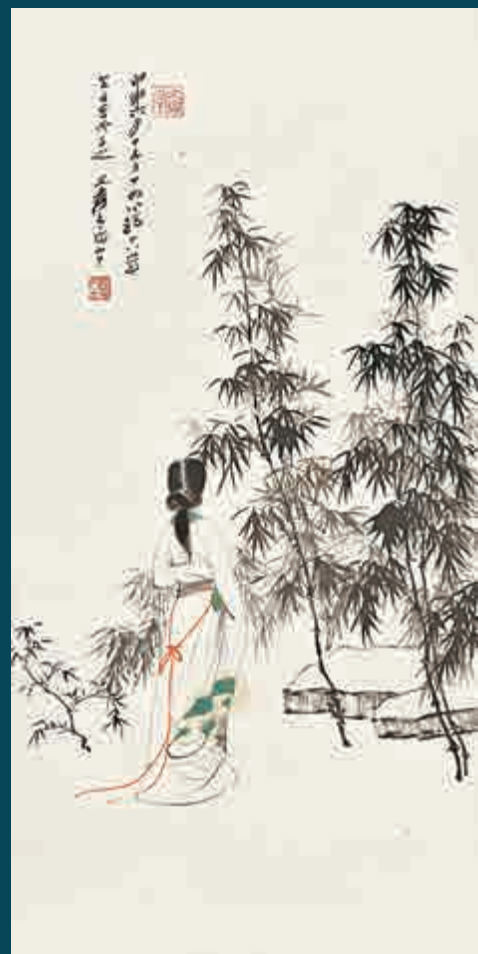
▲張大千一九四四年作品《倩影》，這是張大千贈予張心瑞的十八歲生日禮物