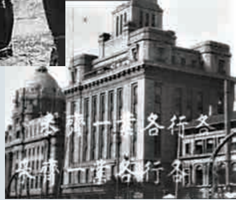
▼《淞滬抗戰紀實》(1937)劇照