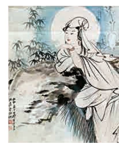
▲張大千《水月觀音》，一九五六年作