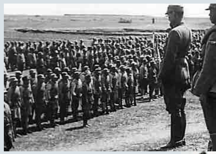
▲《十九路軍抗日血戰史》(1932)劇照

十分鐘紀錄片《國際學生呼籲抗日》記載了世界學生代表來華呼籲全球支援中國，並視察中國軍隊的演練。《廣州大轟炸》則是戰時拍攝的新聞片，見證日軍猛烈轟炸，廣州平民區被毀及人民死傷的慘狀。黎民偉攝製的《動業千