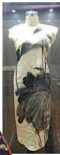
▲張大千手繪《茜苜旗袍》