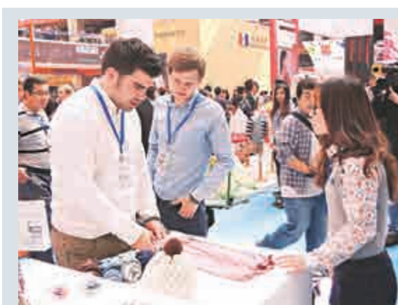
▲香港六月採購經理指數（PMI）為49.2，低於50的持平指標，顯示整體經營環境惡化，顯示轉壞程度僅輕微