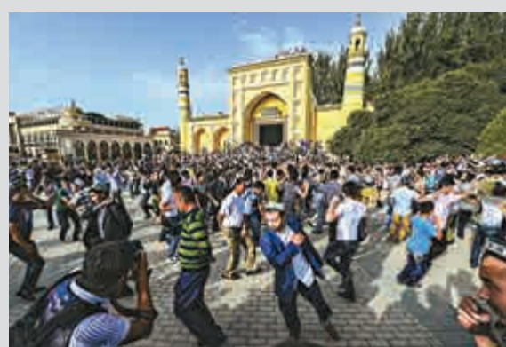
▲穆斯林群衆在喀什艾提尕爾清真寺做禮拜，喜迎開齋節 資料圖片

「今天的新疆，各族民衆生活水平不斷提高，穆斯林信衆宗教活動依法有序地進行，齋月生活一切正