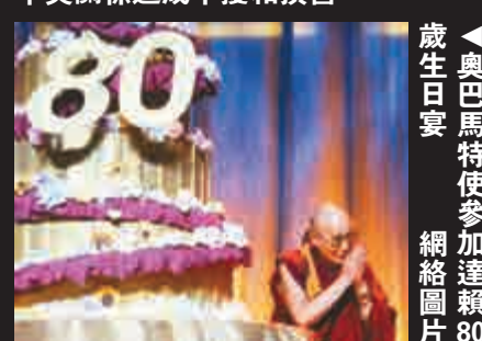
▲奧巴馬特使參加達賴慶生 生日宴 80

華春瑩表示，中方敦促美方恪守承認西藏是中國一部分、不支持「西藏獨立」的承諾，採取切實措施糾正錯誤、消除惡劣影響，停止為「藏獨」勢力提供任何便利和支持，以免對中美關係造成干擾和損害。