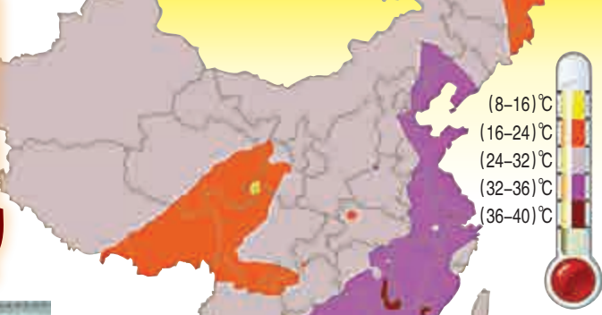
全國最高氣溫預報圖 (7月15日)

【大公報訊】7月13日是中國農曆夏季「入伏」第一天，內地迎來今年來最大範圍的高溫天氣，多個城市發布高溫紅色（最高等級）預警。華北大部、江淮西部、江南中西部、華南大部以及重慶、陝西關中等地有35~37°C的高溫天氣，其中北京、天津、河北中南部、山東西部、河南中北部等地的部分地區可達38~40°C。