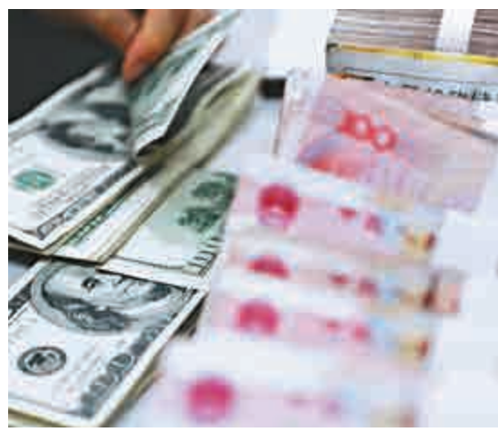
▲分析指，放開境外投資者投資銀行間債券市場，有利於推動人民幣從結算貨幣到投資貨幣再到儲備貨幣的轉變

參加行取消投資額度限制，並擴展其交易品種。交易所層面，允許QFII、RQFII信用債回購交易，加快QFII、RQFII額度審批，並適時允許境外投資機構投資國債期貨市場。