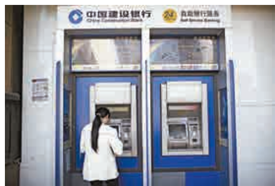
▲海通證券測算指出，上月住戶存款同比少增近8800億元

針對A股近期的大幅波動，李慧勇預計，央行仍可能通過拆借、發行金融債券等方式維持流動性的充足，守住不發生系統性、區域性金融風險的底線。