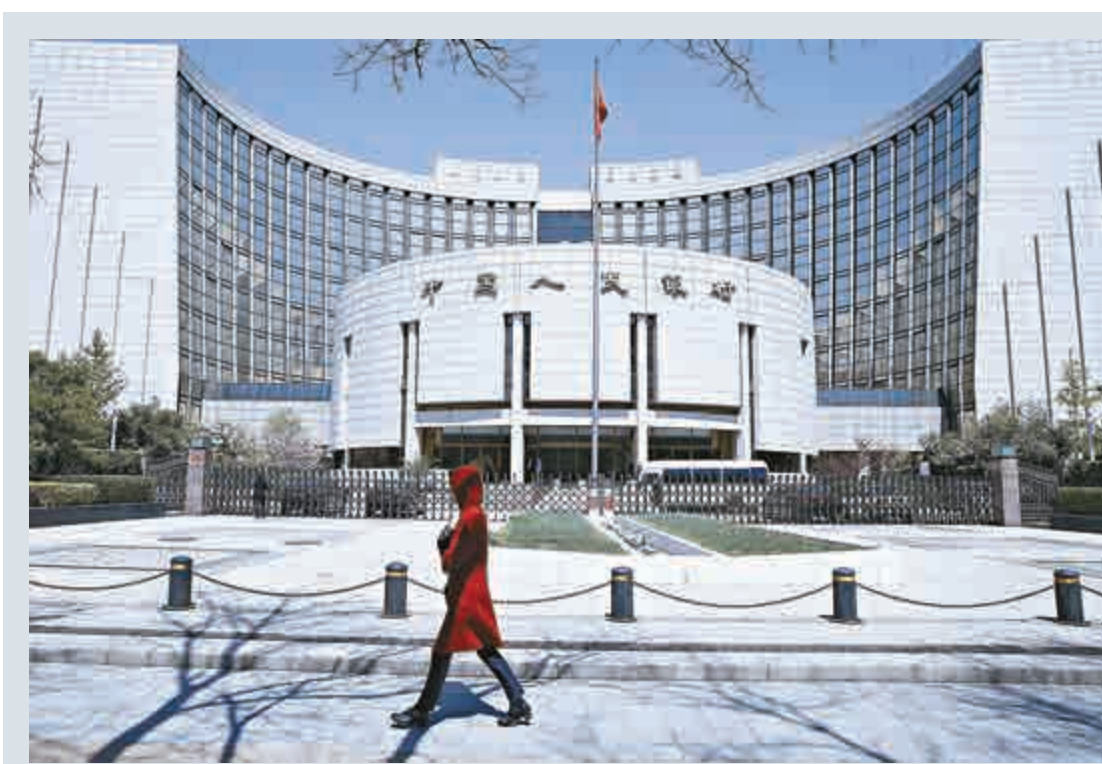
▲中國央行發布的最新金融統計數據報告顯示，6月末，M2餘額133.34萬億元，同比增長11.8%，增速比5月末高1.0個百分點，比去年末低0.4個百分點 中新社