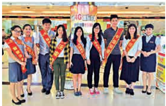
▲香港大學生在濟南聯通營業大廳實習

【大公報訊】記者胡臥龍、實習記者郝辛未濟南報道：14日上午9時，2015香港大學生來魯實習計劃總結會在濟南聯通公司舉行，來自香港14所大專院校的42名學生結束了為期一個月的實習生活。雖然時間短暫，濟南的學習生活卻給他們留下了充實、愉快的回憶，很多學生表示已愛上泉城濟南，捨不得離開。