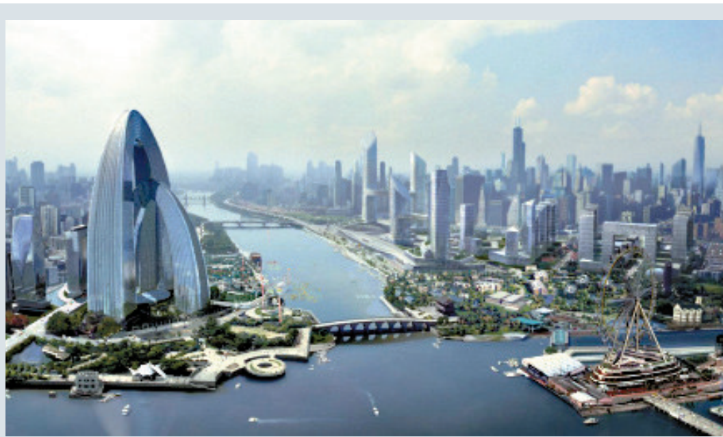
▲北京確定通州為行政副中心。圖為行政副中心規劃圖 網絡圖片

根據調整的規劃，此前規劃實施的一些集聚人口的產業園將做調整。此外，還將推動倉儲物流基地、批發市場、物流基地以及農村集體建設用地不適應產業等業態的退出升級，取而代之的是一些高端產業，例如有可能承接中心商務區的一些功能。