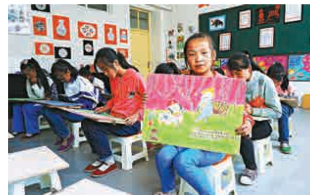
▲2013年「7·22地震」中甘肅省定西市岷縣梅川鎮茶園小學損毀嚴重。重建後的茶園小學共有239名學生在這裡快樂學習

據悉，目前，甘肅省市共下達岷縣「7·22」災後重建項目746項，總投資68.64億元（人民幣，下同），累計完成投資58.6億元。其中，住房重建和集中安置項目共32項，總投資達500億元，項目全部完成並具備入住條件，惠及受災居民逾10萬戶。預計今年10月份各項工作將全部完工，安置居民可全部遷入安置點。（記者 劉俊海）