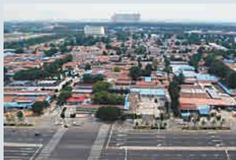
▲通州新城規劃的理念是「優化升級」。圖為通州市景 網絡圖片