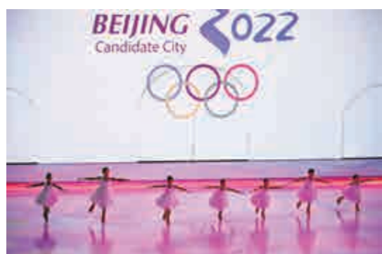
▲「冰上雅姿」盛典日前轉戰北京，多位大師級花樣滑冰選手精彩的表演將申冬奧激情推向高潮。圖為小花樣滑冰選手在暖場表演中

對於延慶與張家口的雪場及設施，巴萊接受採訪時表示雪場建設是一個浩大的工程，延慶與張家口具有非常優越的自然條件，其山形山貌完全具備舉辦滑雪賽事的條件。他表示，延慶與張家口相關場館的設施建設已滿足冬奧會相關賽事及其他國際大型滑雪賽事的要求。「毫無疑問，在未來的幾年中，中國完全有能力做好2022年冬奧會的準備。」