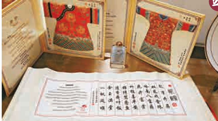
▲白天鵝賓館菜譜古色古香

黑臉琵鷺 黑臉琵鷺是全球瀕危珍稀物種，目前僅存3272隻，其中台灣地區2034隻，香港411隻，內地330隻，其餘散見東亞及東南亞地區。黑臉琵鷺夏季飛回北方繁殖，10月下旬陸續飛回南方過冬。因其姿態優雅，又被稱為「黑面天使」。