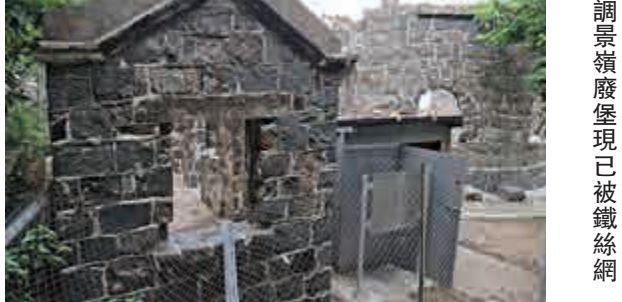
調景嶺廢堡現已被鐵絲網圍封

不少人只視古蹟為拍照場景，對其歷史和特色毫不關心。調景嶺廢堡過去一直被人忽略，市民亦不知道它的重要價值，更有人在堡內的麻石牆壁刻字。約兩年前，古蹟辦在該處設置介紹牌，以喚起市民對建築文物的注意。近年有傳媒報道廢堡，吸引一些攝影師到來，當中有人罔顧法規，致令現在所有行經廢堡的人都不能入內參觀。