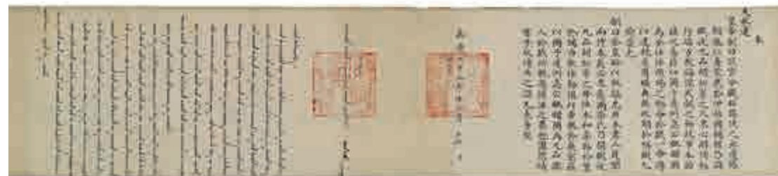
▲清嘉慶二十三年頒發給胡松率父母的敕命聖旨

而今，建於二〇一二年的徐州聖旨博物館，現已成為國家AAAA級旅遊景區，獲得中國文化實踐基地、中國十大民間博物館等榮譽稱號。