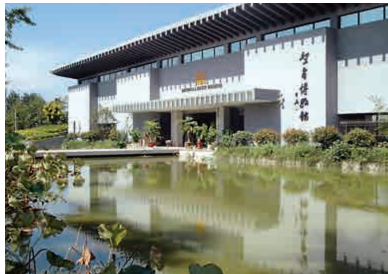
▲徐州聖旨博物館外景

「九里山前古戰場，牧童拾得舊刀槍。順風吹動烏江水，好似虞姬別霸王。」在江蘇徐州市北郊的歷史名山——九里山北麓，有一座民營徐州聖旨博物館，以收藏與展示誥封聖旨名揚海內外，是目前內地首個規模最大、最早以聖旨為載體的皇牘文化博物館。館內藏有絲質、木刻、石刻等多種質地的明清聖旨二百三十餘道，其中最早的聖旨為明代洪武年間，清代有從大清進關開國皇帝順治到末代皇帝溥儀十代皇帝的聖旨。