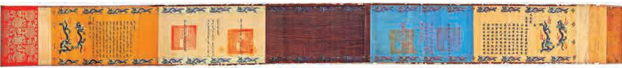
▲道光咸豐兩帝頒發給八大「鐵帽子王」之一代善後代奎定、玉綱的「世襲罔替」龍邊聖旨