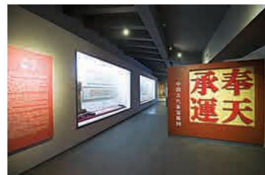
▲徐州聖旨博物館聖旨陳列館「奉天承運」展區