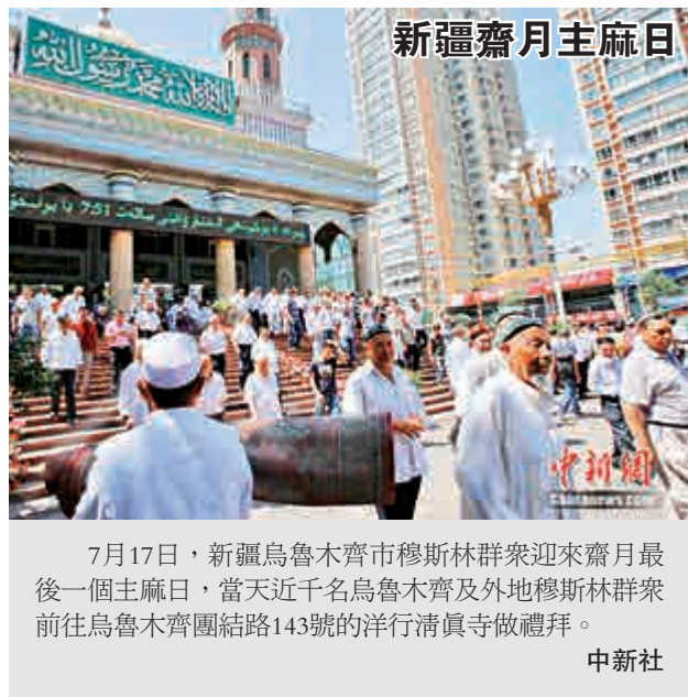
新疆齋月主麻日 7月17日，新疆烏魯木齊市穆斯林群衆迎來齋月最後一個主麻日，當天近千名烏魯木齊及外地穆斯林群衆前往烏魯木齊團結路143號的洋行清真寺做禮拜。

國家旅遊局要求，已核定公布最大承載量的各旅遊景區，都要嚴格按照《旅遊法》要求，強化最大承載量管理，依法實施最大承載量控制措施，切實提升旅遊安全管理水平，確保遊客人身財產安全。