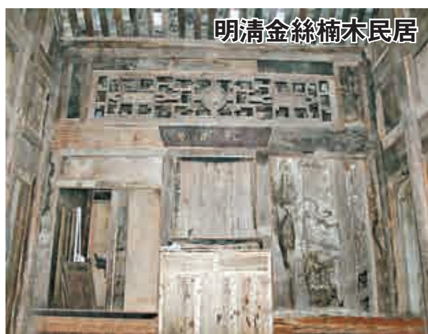
明清金絲楠木民居 日前，湖北恩施土家族苗族自治州林博園內現整棟金絲楠木民居，該民居爲明清建築，木料全爲名貴的金絲楠木，最大年輪的金絲楠木達千年，整棟房子有150餘平方米，該棟明清時期的民居價值千萬以上。 中新網

爲了更好地保護、傳承水族文化，自2003年起，三都縣向社會開展「水書」徵集工作，2012年起，將部分「水書」轉化成數字形式，目前已徵集到9000餘冊，此外還設立珍貴檔案「特藏室」等。