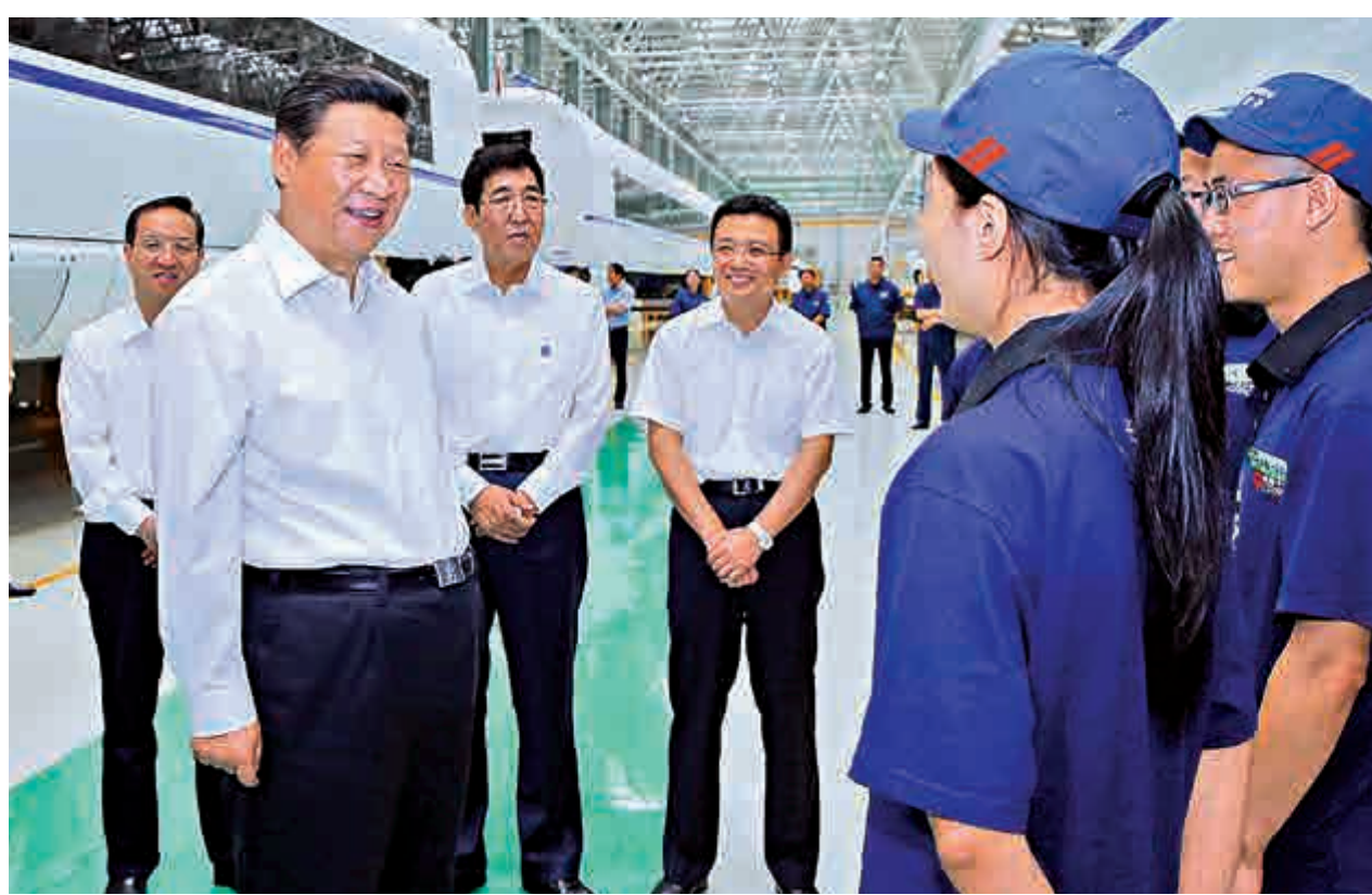
▲習近平17日考察中車集團時表示，中國的高鐵動車已成一張靚麗的名片 新華視點

習近平在同吉林省企業職工座談時指出，國有企業是國民經濟發展的中堅力量。對國有企業要有制度自信。深化國有企業改革，要沿着符合國情的道路去改，要遵循市場經濟規律，也要避免市場的盲目性，推動國有企業不斷提高效益和效率，提高競爭力和抗風險能力，完善企業治理結構，在激烈的市場競爭中游刃有餘。