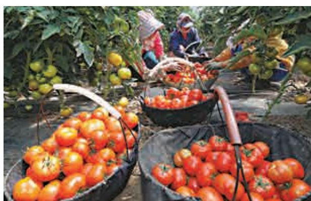
▲在黑龍江牡丹江市，一家蔬菜生產合作社的社員在採收準備出口俄羅斯的番茄 新華社

海關總署副署長鄒志武也表示，目前海關正加快推進形成全國一體化通關改革。將改革現行申報制度，建立一次申報、分步處置制度；改革現行稅收徵管方式制度，實行批量審核和稅收稽查；改變以往以關區為塊的監管模式，建立若干功能型海關。