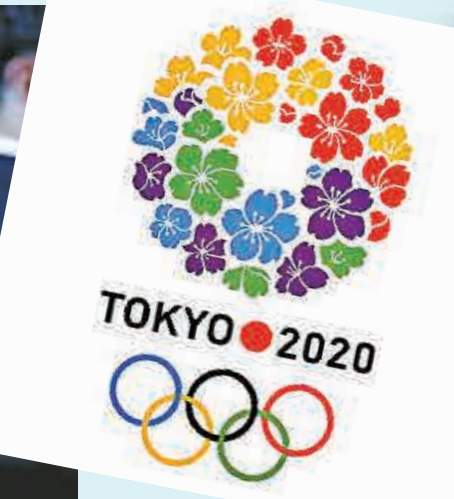
▲東京申辦2020年奧運會標誌 資料圖片