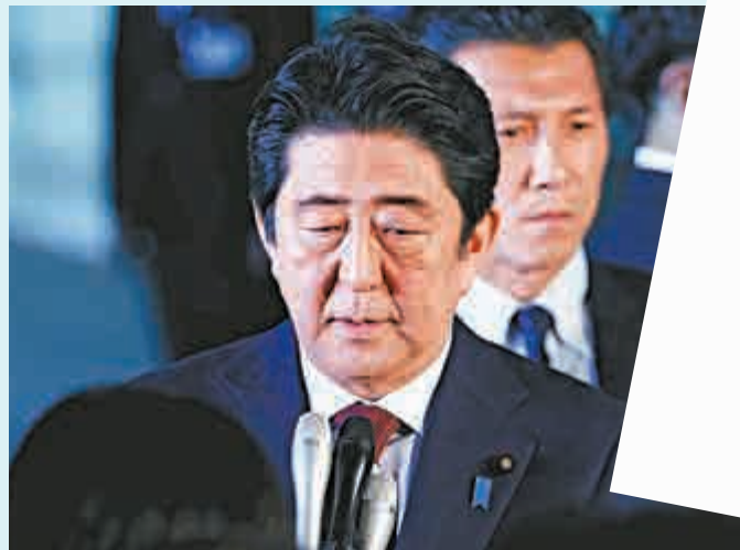
▲日本首相安倍晉三17日召開記者會