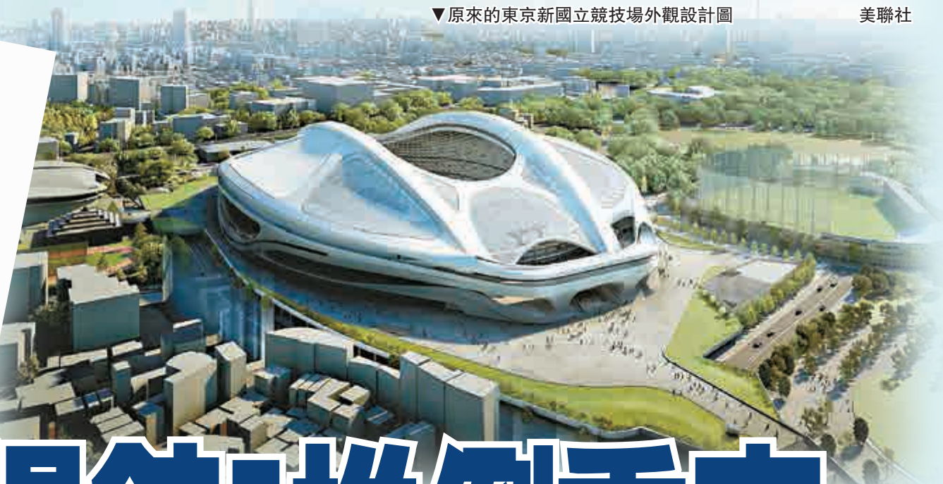
▼原來的東京國立競技場外觀設計圖