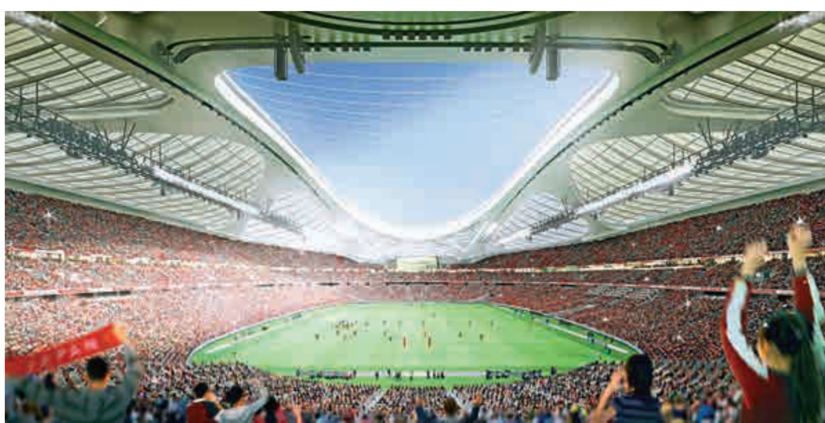
▲東京國立競技場原設計場內示意圖

日本官員表示，場館造價上升，有三分之一的原因是受勞動力和建築材料供應的影響，這些問題也會影響新設計。