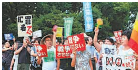
▲抗議新安保法的民眾17日繼續在東京示威

另據《紐約時報》報道，新國立競技場原本的英國設計師哈迪德去年一度透露，日本人在主場館這件事情上存在很深的民族沙文主義。她說，「他們不想要一個外國人來建國家體育場。」