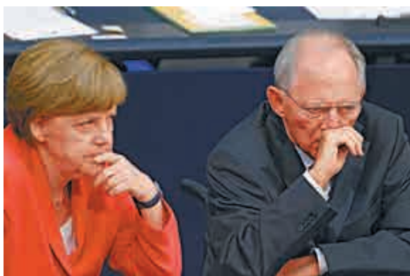
▲德國總理默克爾（左）與財長朔伊布勒17日在議會辯論期間表情嚴肅 路透社

【大公報訊】綜合路透社及彭博社17日消息：德國議會17日明確支持默克爾政府，以大比數通過了新一輪對希臘援助計劃，進一步為希臘獲取國際債權人提供的