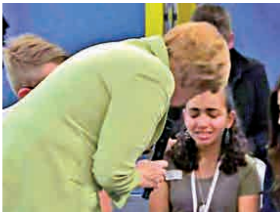
▲德國總理默克爾16日安慰一名痛哭的難民女童

相關的影片在推特（Twitter）上引發熱議，有人批評默克爾處理方式過於冷酷。不過，也有超過6成網友認為默克爾的處理方式正確，雖然這樣的難民家庭如果被驅逐出境令人難受，但德國去年接受20萬人庇護申請，今年預估會再收容多達45萬人。