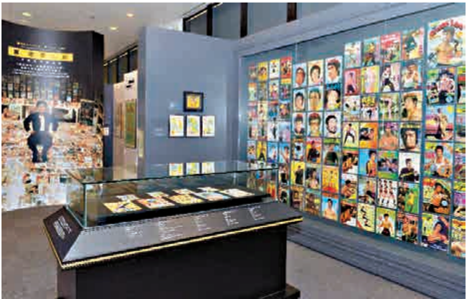
▲「賞·念 李小龍——收藏家珍藏系列」展覽一角

為期五年的「武·藝·人生——李小龍」展覽，自二〇一三開幕以來，吸引了百多萬人次參觀。最新系列的藏品也將在該展區展出，市民可以透過展覽，認識李小龍的成就和貢獻，同時了解收藏家陳振輝眼中的這位巨星。有關展覽詳情可瀏覽香港文化博物館網頁： www.heritagemuseum.gov.hk/zh_TW/web/hm/exhibitions/data/exid209.html 。