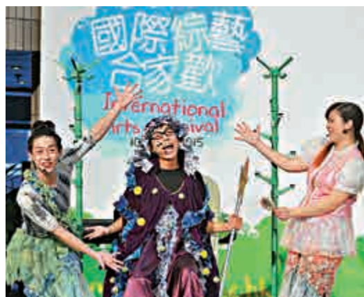
▲該劇由iStage製作，故事靈感來自童話《美人魚》

有關節目詳情可致電二五九一三四〇或瀏覽網址： www.lcsd.gov.hk/tc/ea/territoryevents/internationalarts/IAC2015.html 。