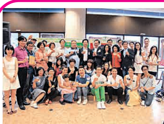
▲普劇團的要員與一眾嘉賓於開幕禮現場合影