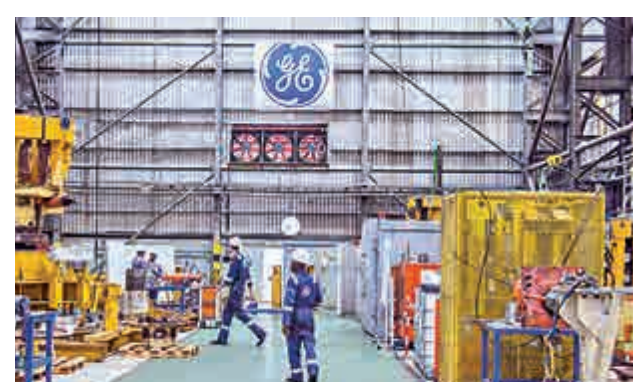
▲不計及匯率變化和交易因素，通用電氣的製造業部門盈利上季增長了一成一

今年二月日本一度超越中國成為美國「最大債主」，但隨着中國三月大幅增持373億美元美債，再次超越日本回到美國「最大債主」位置；四月中國繼續增持美債，規模為24億美元。