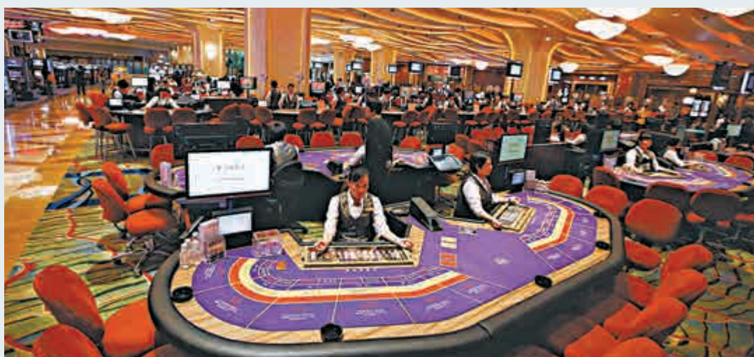
▲摩根大通料目前濠賭股公布第一季業績後，將出現較佳的買入機會