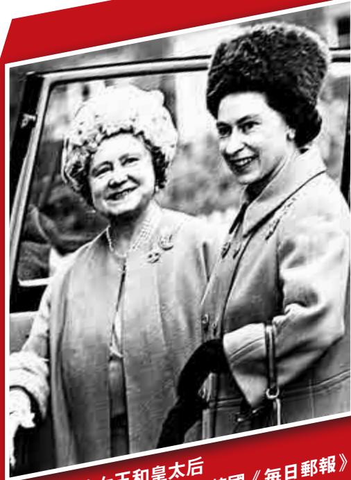
年輕時的女王和皇太后 英國《每日郵報》

英國《衛報》此前從美國聯邦調查局（FBI）解密檔案中獲悉，二戰期間，美國前總統羅斯福曾親自下令秘密監視溫莎公爵夫婦，以提防他們在美國時把機密洩露給德國納粹分子。這是因為美國從情報中判斷，溫莎公爵夫人沃麗絲·辛普森曾與德國納粹黨的一名高級官員來往過密，並一直向他提供重要的政治和軍事情報。