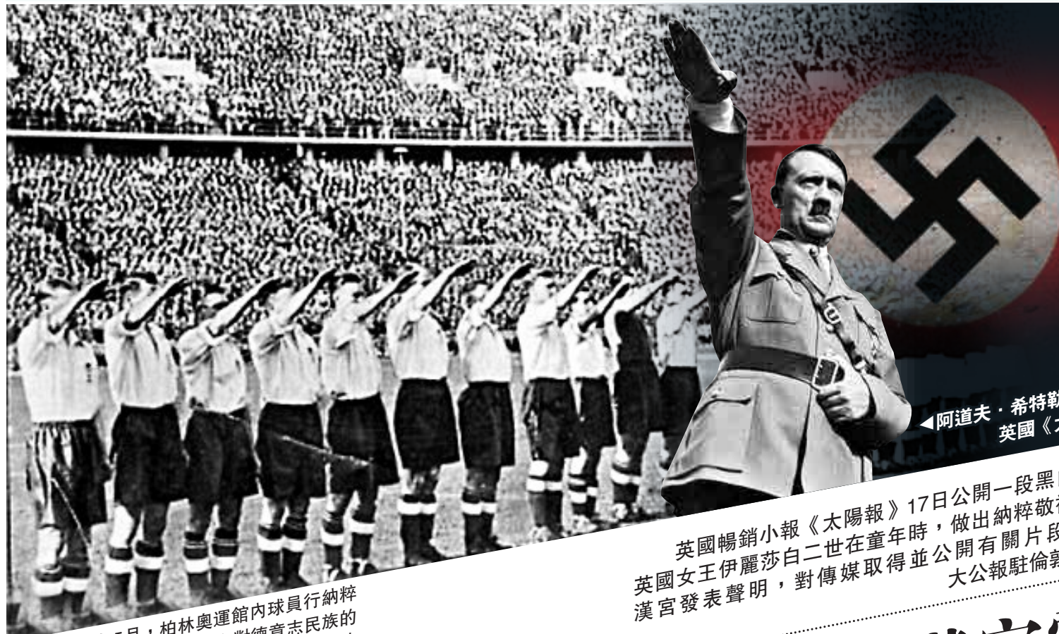
阿道夫·希特勒