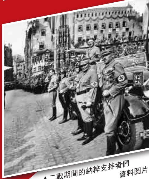
二戰期間的納粹支持者們 資料圖片

，但認為女王在二戰期間表現出對國家的責任感並讓英國人引以為傲，沒有人會認為她同情納粹德國。況且當時女王年幼，未必知道這個手勢的意思，不過影片無疑令女王感到尷尬。