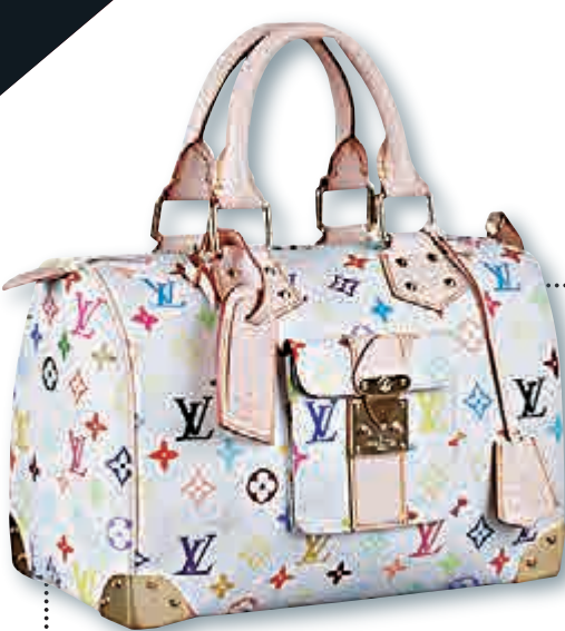
LV彩色字母款手袋「Multicolore」系列將停產

目前兩套理論：冰原或許是由地表面物質收縮，類似泥土乾涸龜裂的情況；或者，可能是經過所謂的對流作用，冥王星內部某種熱能，重塑造結的一氧化碳、甲烷和氮組成的表面層。