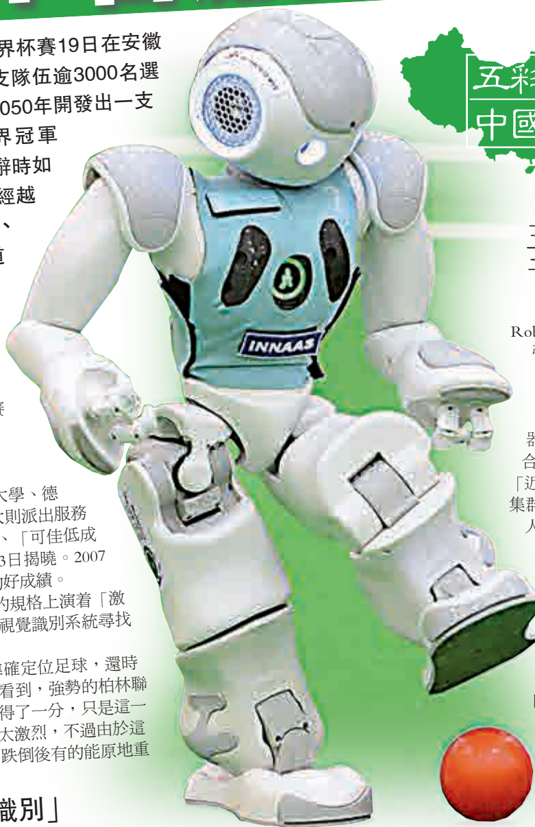
▲機器人球員在比賽中進攻

據介紹，本屆RoboCup世界杯是有史以來創新性最強的一屆世界杯。如服務型機器人在比賽中有一項精確測試，也是全球首次大規模的精確測試。精確測試是當前國際機器人研究領域競爭的焦點之一，因此對目前國際服務型機器人研究瓶頸的突破有着積極的意義。