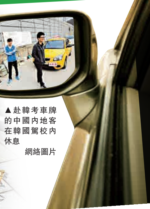
▲赴韓考車牌的中國內地客在韓國駕校內休息