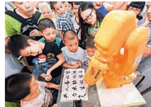
▲參展工業機器人表演書法

據國際機器人聯合會最新報告顯示，中國在2013年已成為全球最大的工業機器人消費市場。預計到2017年，中國工業機器人的使用量將達到42.8萬台。隨着產業轉型升級不斷向縱深推進，機器人應用範圍將越來越廣，機器人產業將迎來一個重要發展機遇期。