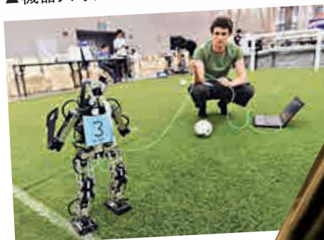
▲參賽選手在做準備