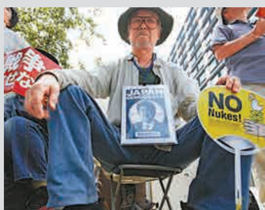
▲示威者7月27日在東京抗議安倍政權，要求實現無核化

原爆幸存者試圖確保他們的經歷不會隨他們一同步入墳墓。然而，今年早些時候，日本原子彈和氫彈受害者協會理事會（hidankyo）最活躍的一個分支宣布解散，因為大部分成員都已經80、90多歲，他們已經太老而無法再進行活動了。