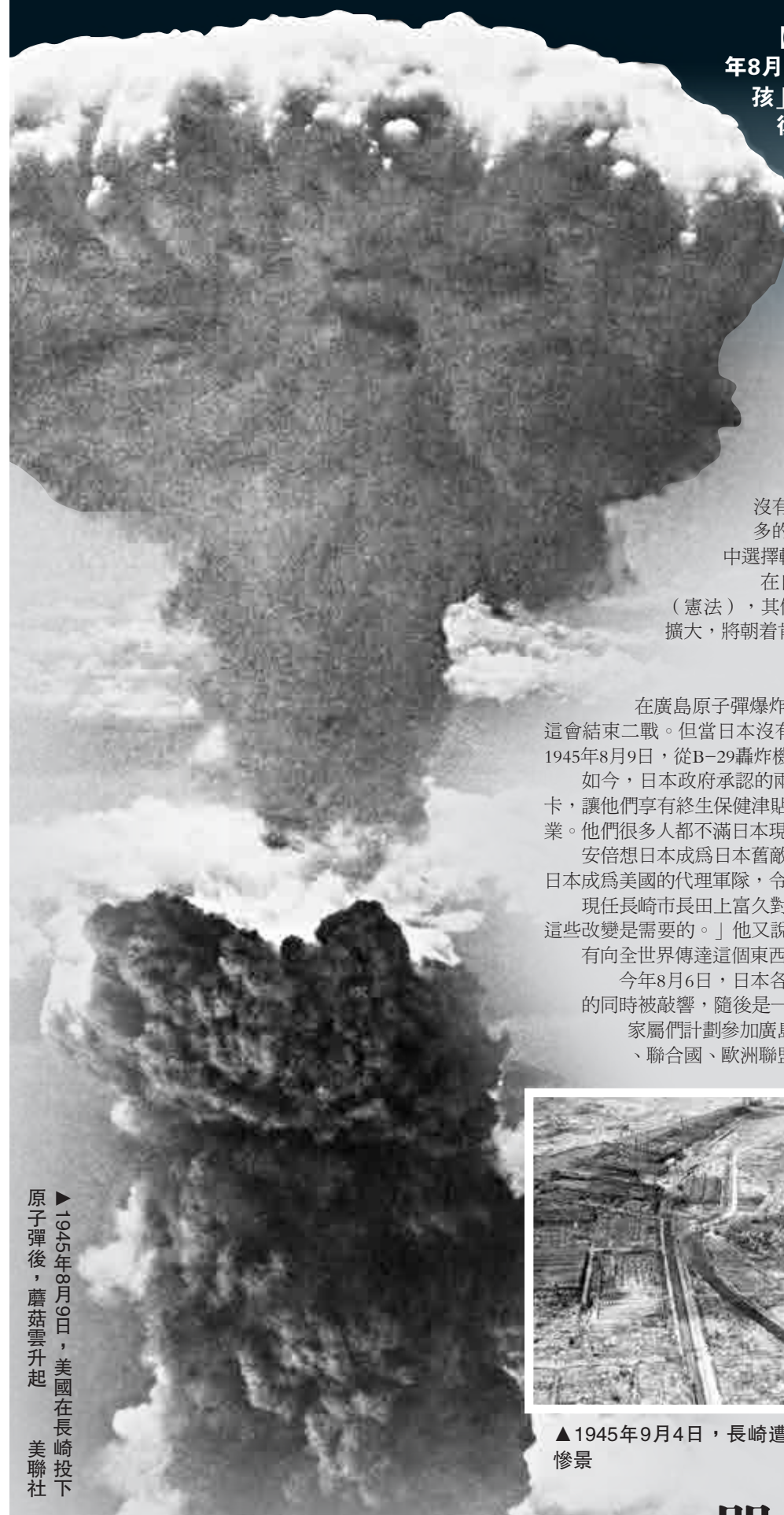
▲1945年8月9日，美國在長崎投下原子彈後，蘑菇雲升起

【大公報訊】綜合英國《獨立報》、共同社及美聯社報道：1945年8月6日，美國在日本廣島投下第一顆以人類為目標的原子彈「小男孩」，爆炸的直接襲擊及核輻射傷害，導致超過20萬人死亡。70年後，日本首相安倍晉三強推新安保法案，一步一步將日本推向戰爭國家，共同社針對原爆幸存者的民調顯示，近七成受訪者基於自身的悲慘經歷，認為「不應該再次進行戰爭」，而堅持憲法第9條有助於實現「不戰」。