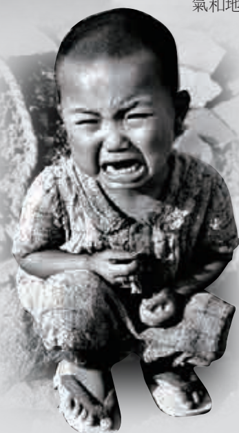
▲廣島原爆後，一名幸存孩童在廢墟中哭泣