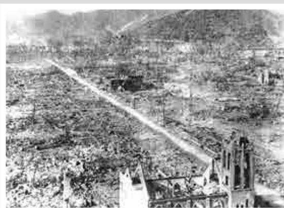
▲1945年9月5日，廣島原爆後，一座天主教堂損毀嚴重