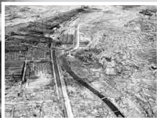
▲1945年9月4日，長崎遭遇原子彈爆炸後的慘景

今年8月6日，日本各地將舉行活動紀念原子彈爆炸70周年，廣島和平紀念公園之鐘將在原子彈爆炸的同時被敲響，隨後是一分鐘的默哀，之後首相安倍晉三將發表主題演講。大約有45000幸存者及家屬們計劃參加廣島紀念儀式，美國駐日大使卡羅琳·肯尼迪、70個其他國家代表們、聯合國、歐洲聯盟及其他國際性組織亦出席該典禮。