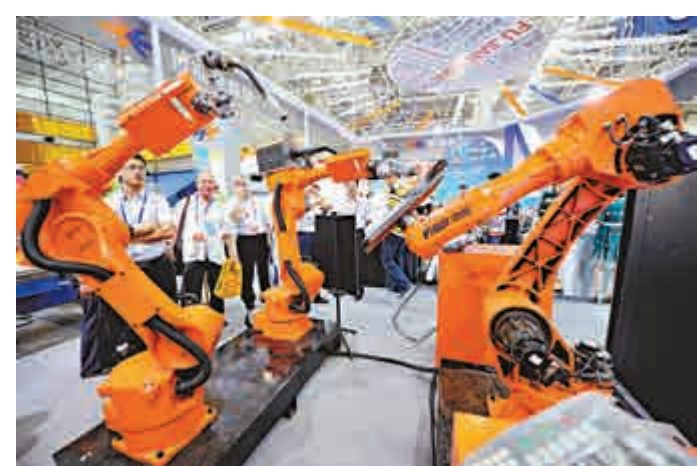
▲創新創業、產業轉型升級為中國經濟帶來新活力。圖為企業在展會上展示智能裝備 資料圖片

列政策措施不斷釋放出改革開放紅利，極大地激發了企業和投資者的積極性，增添了市場活力，為實現7%左右的增長目標提供了持續性源泉。「只要我們創新調控方式，完善調控手段