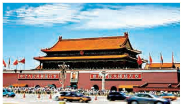
▲北京將採取污染企業停產限產、機動車單雙號限行等措施保障閱兵活動期間空氣質量 資料圖片

【大公報訊】實習記者劉美君北京報道：為保障抗戰勝利70周年紀念活動期間北京的空氣質量，北京將參照奧運及APEC標準，啟動重大活動空氣質量保障工作。從8月20日至9月4日，北京大氣污染物排放重點工業企業實施停產限產措施；從8月20日至9月3日，全市機動車將實行單雙號限行。保障方案在設計時優先考慮在生產領域採取措施，其次