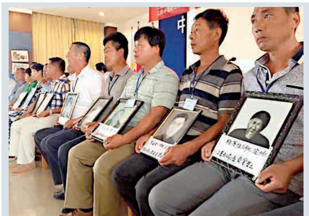
▲二戰中國受害勞工遺屬代表在聲明發布會現場

「在抗日戰爭勝利70周年之際，如果能實現此和解，我們認為對推進中日友好及世界和平具有重大積極意義。因此要求三菱公司拿出誠意早日與我們受害者達成和解。」這份聲明指出。