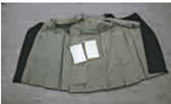
▲海關展示走私象牙男子所穿的走私背心 海關圖片

上月27日，一名27歲報稱商人男子，從尼日利亞拉各斯出發，經迪拜飛抵本港。海關人員發覺他步姿異常。經調查發現該男子在其鬆身外衣下，再穿一套特別縫製的背心及短褲，內藏約15公斤懷疑象牙及象牙製品。他被控一項非法進口瀕危物種的罪名，並於上月28日在荃灣裁判法院提堂並定罪，被判罰款六萬二千元。