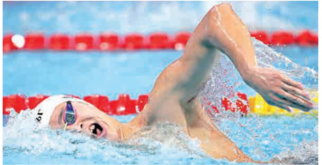
▲孫楊在本屆賽事憑着400米自由泳及800米自由泳，奪得兩金