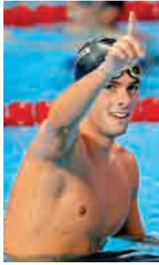
▲意大利的佩萊格里尼奪得男子千五百米自由泳金牌

香港的「美人魚」歐鎧淳亦游出佳績，她在女子4×100米混合泳接力賽初賽為港隊負責背泳首棒時游出1分00秒95，刷新自己所保持的1分01秒06香港紀錄，最終港隊在預賽名列第20，無緣晉級。