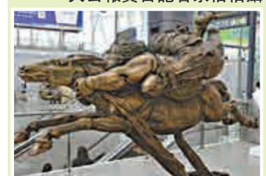
▲裝置在出發大廳的《馬上飛》 貼合旅客心情