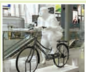
▲大型雕塑作品《迎風》