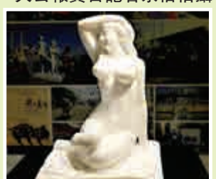
▲漢白玉材質的作品《西關小姐》

【大公報訊】記者劉毅報道：由香港數碼娛樂協會主辦、香港特別行政區政府「創意香港」辦公室贊助、香港生產力促進局共同策劃的第三屆「動畫支援計劃」，昨日在九龍塘生產力大樓舉行啓動儀式，十五間本地初創及小型動畫企業將獲「支援計劃」資助製作原創動畫。