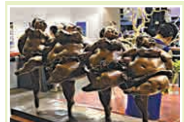
▲小型雕塑作品《四個小天鵝》