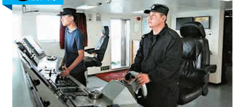
▲14日，三沙市綜合執法船駛離永興島，前往西沙樂群島開展為期兩天的島礁生態保護巡查