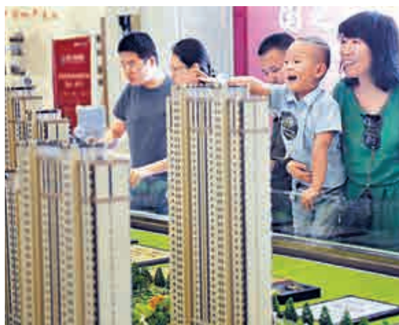
▲分析指內地樓市淡季銷售卻不淡，相信可為內房股沖喜

上半年多賺74%兼派特別息的中國奧園（03883），股價升9.5%，報1.61元。恒大地產（03333）股價升4.9%，報5.13元；首創置業（02868）升4.1%，報3.74元。融創中國（01918）股價有2.3%進帳，報6.43元。內地7月份商品房銷售4.12萬億元人民幣，按年增加13%，反映內地A股股市對住宅市場影響不大。值得注意的是，首7個月住宅項目投資增加3%，較首6個月上升0.2個百分點。另外，內地十大城市7月份一、二線城市合約銷售按年增加66%、70%，待售面積消化時間下降至7個月、11個月。分析指出，內地樓市淡季不淡，相信可以為內房股沖喜，惟市場資金有限，限制內房股向上空間，不可能回升至5月份高位。