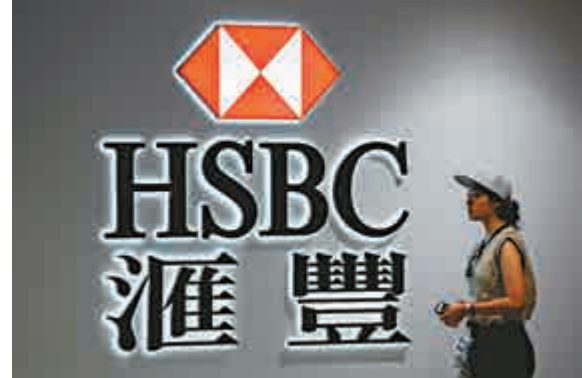
▲滙控在恒指所佔比重自9月14日起將減至10%