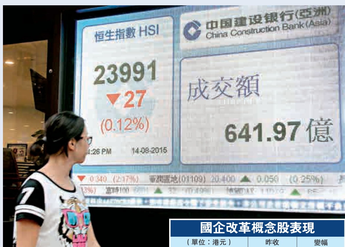
▲恒指昨反覆偏軟，開市最多升107點，惟升勢曇花一現，收市跌27點，報23991點 中通訊