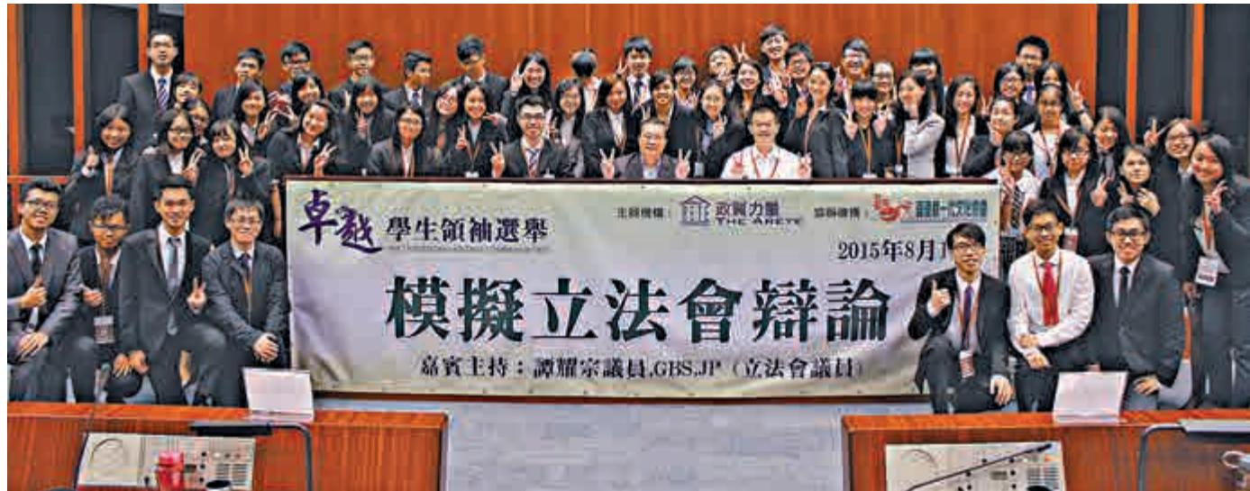
▲模擬立法會議員的同學們，與立法會議員譚耀宗合照留念

加快更換喉管和驗血等工作。對於有人質疑民主黨延遲公布食水含鉛的化驗結果，是希望以此作為區議會選舉議題，譚耀宗回應說，鉛水事件不應直接跟選舉掛鈎，他本人亦不希望實情如此。此外，被問到民建聯會派多少人出選區議會，譚耀宗表示，現時未有定論，要由民建聯的中央委員會決定，準備參選的人都已積極籌備，派出的人數不會少於現時區議員人數。