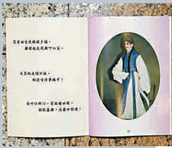
▲《唐明皇哭太真》及《五湖泛舟》可是聲哥的至愛？