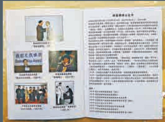
▲場刊內有聲哥獲授勳等的威水史