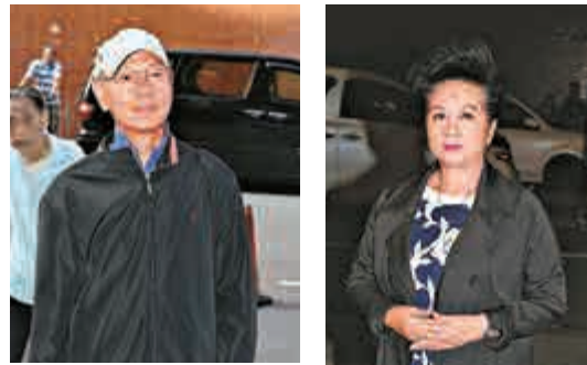
▲家英哥欣賞聲哥演出 ▲家燕姐指從聲哥身上學到很多東西

【大公報訊】記者溫穎芝報道：一代粵劇名伶林家聲本月四日與世長辭，享年八十二歲。昨日聲哥家人在世界殯儀館為其設靈，喪禮以佛教儀式進行，今早十時四十五分大殮，中午十二時出殯，靈柩隨即送往和合石火葬場火化。