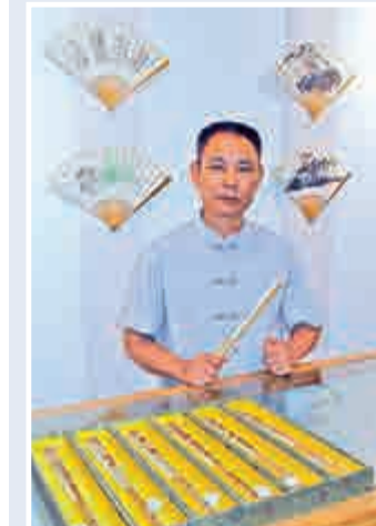
▲鄭高製作的「梅鹿合竹摺扇」、「香妃摺扇」一組