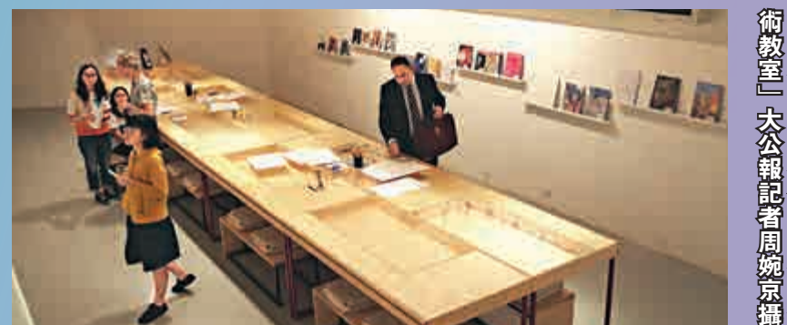
▲開幕首日，觀者流連在「藝術教室」