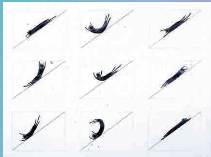
▲落合多武作品《Drawing for Cat Slide》