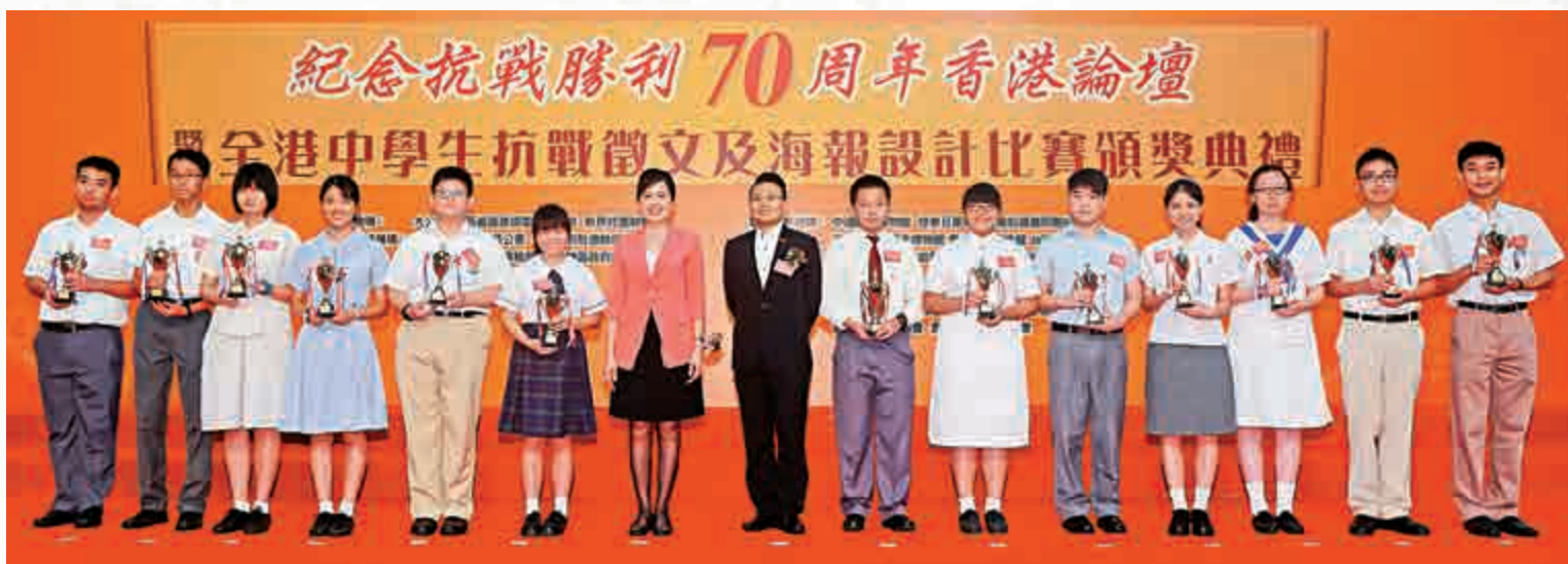
學界積極參與徵文及海報設計比賽，大會最終選出20位中學生獲獎

大公報記者 劉家莉 實習記者 羅嘉雯 關慧珊 盧穎珊(文)