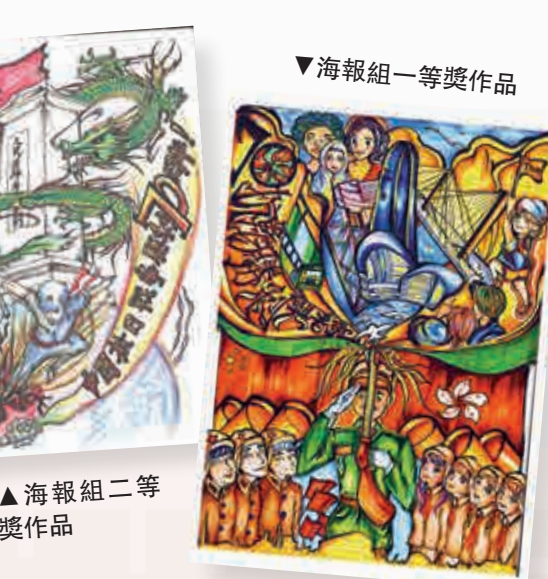
海報組一等獎作品