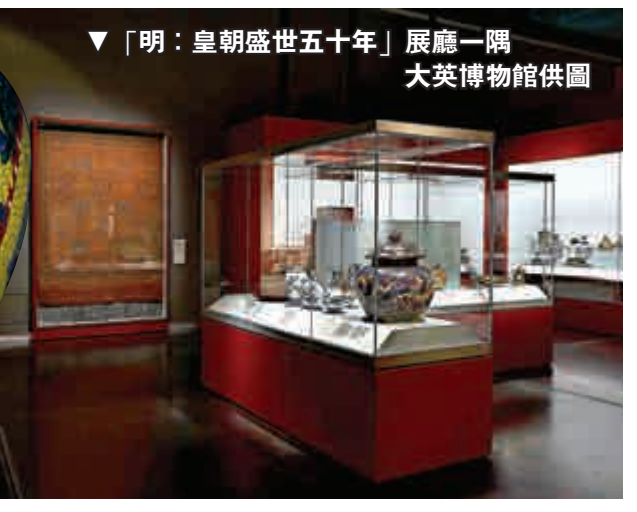
▼「明：皇朝盛世五十年」展廳一隅