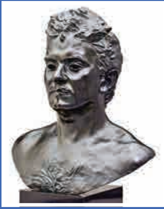
羅丹作品《巴爾扎克肖像》