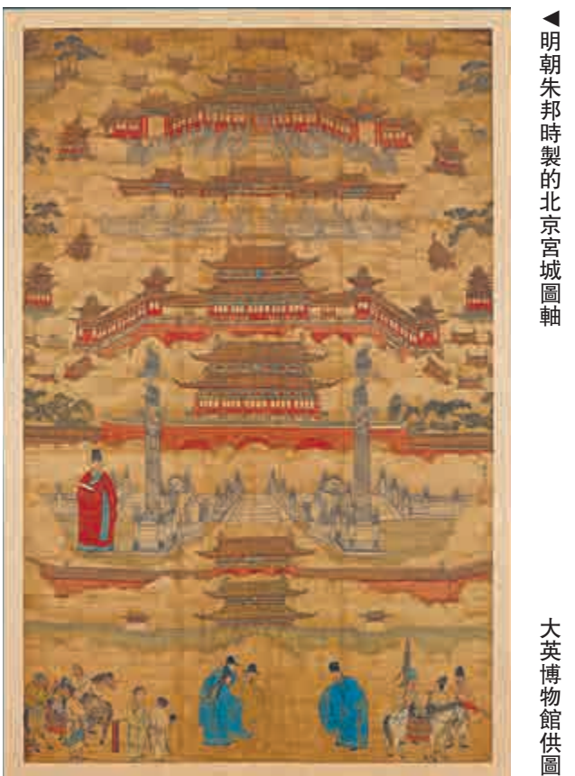
▲明朝朱邦時製的北京宮城圖軸