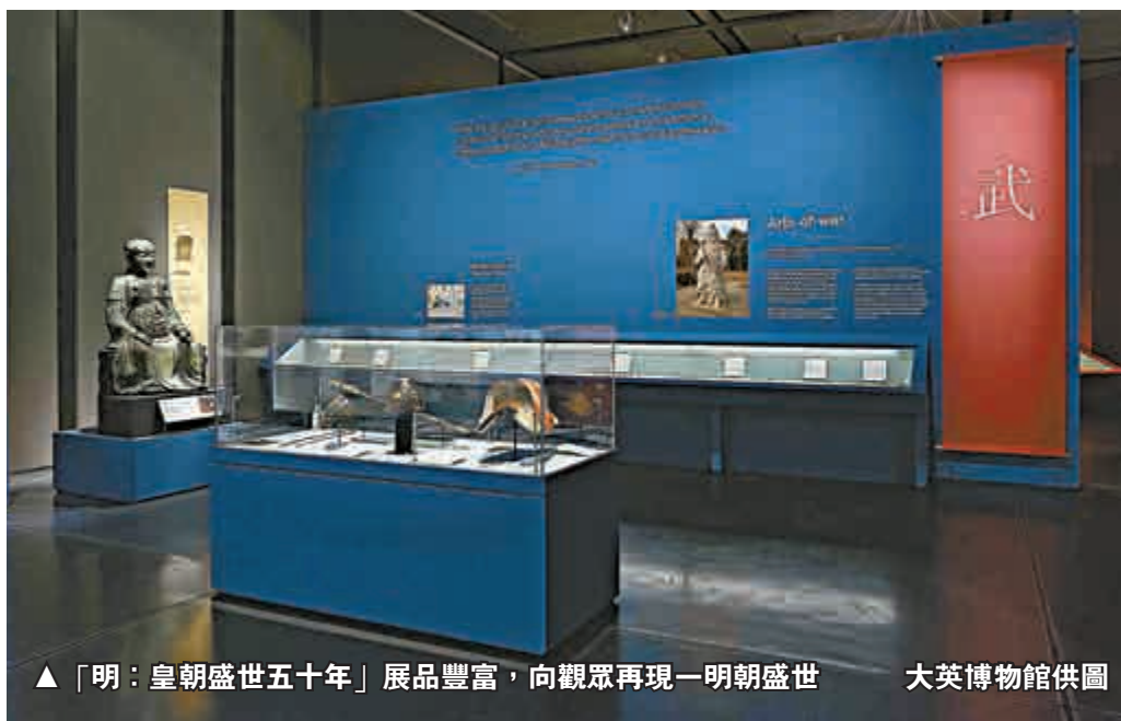
▲「明：皇朝盛世五十年」展品豐富，向觀眾再現一明朝盛世

明朝（一三六八至一六四四年）統治中國近三個世紀，明朝定都北京，《永樂大典》開始編纂、鄭和下西洋等事件都發生在此期間，與中外交流頻繁，是中國歷史的黃金時期。大英博物館早前和中外多間博物館合作，舉辦了題為「明：皇朝盛世五十年」（Ming: 50 years that changed China）的大規模專題展，展示二百八十件中國文物，近三分之一是大英博物館藏品，向世界各地的觀眾介紹輝煌的明朝歷史。