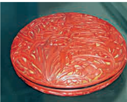
▲別紅雕漆花卉紋蓋盒