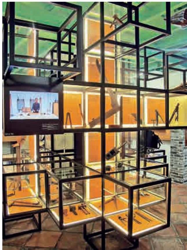
▲位於陳列室中央的四面展示櫃