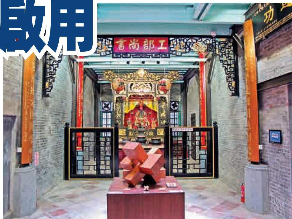
▲魯班先師大殿展示着大型魯班鎖和供奉的魯班像 大公報記者王南薰攝 ▲陳列室內展示着傳統建築中卯榫結合的應用 大公報記者王南薰攝

「魯班先師木工藝陳列館」即日起免費開放，詳情可電澳門文化局：（八五三）八九九六六九九。