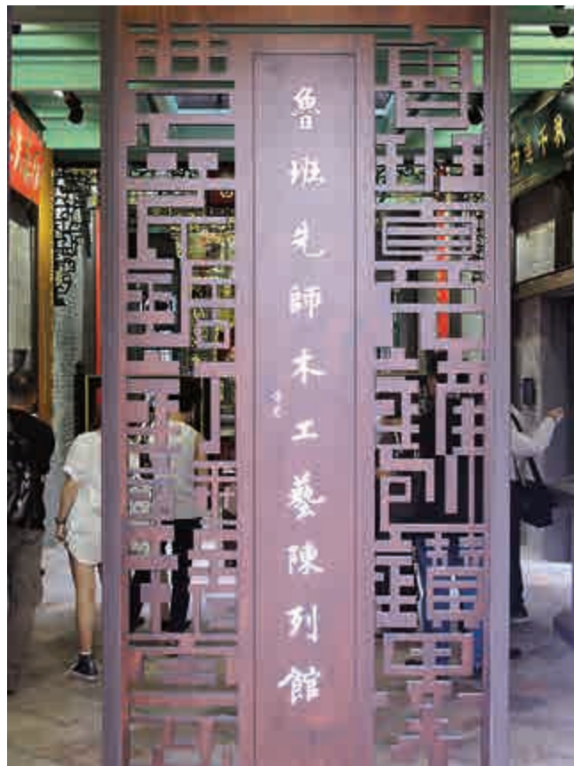
▲魯班先師木工藝陳列館門牌