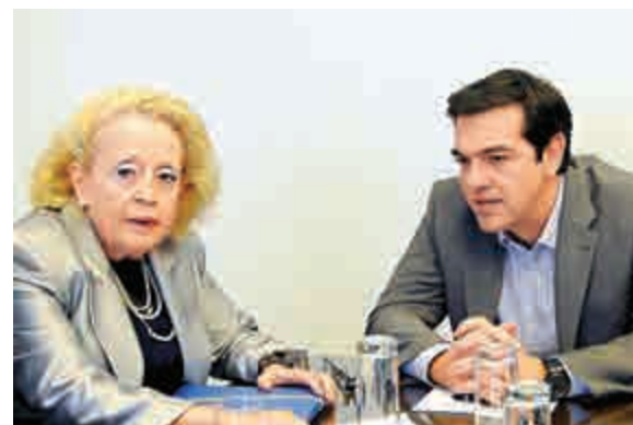
▲希臘新任看守總理薩努（左）與希臘前總理齊普拉斯