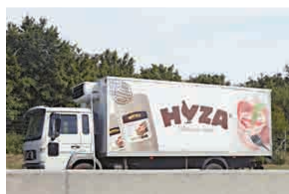
▲奧地利警方27日在一條高速公路上的棄置貨車上發現50具難民遺體

目前，大批難民在英法海底隧道的法國一側的邊境城鎮加萊聚集，伺機偷渡前往英國。倫敦當局已加大巡查力度，並與巴黎方面合作，防止難民湧入。