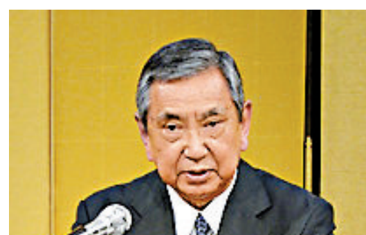
▲前日本眾議院議長河野洋平27日在大阪市的演講批評安倍談話

「聽起來不錯，但（實際情況）如何呢。是通過強化軍事同盟保護日本嗎？了解過去的人應該會抱有危機感」。