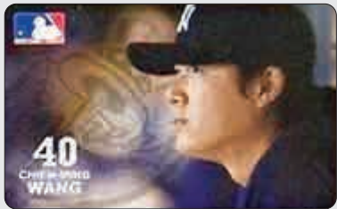
美國職業棒球運動員