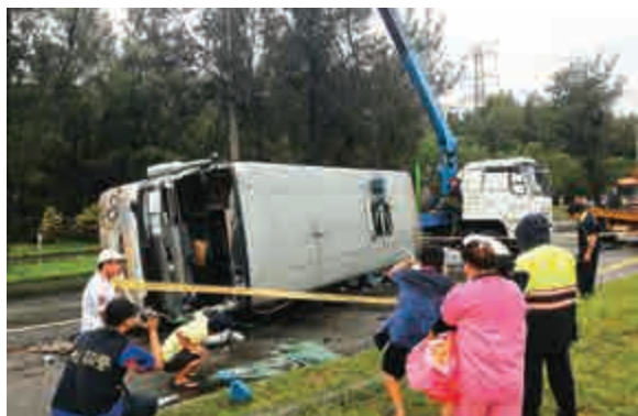
▲一輛搭載陸客的車輛27日在屏東縣翻車

【大公報訊】據中通社報道：搭載大陸旅遊團的遊覽車27日下午在台灣屏東翻車，造成1名女性陸客死亡，以及13人受傷。