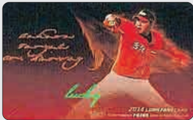
美國職業棒球運動員