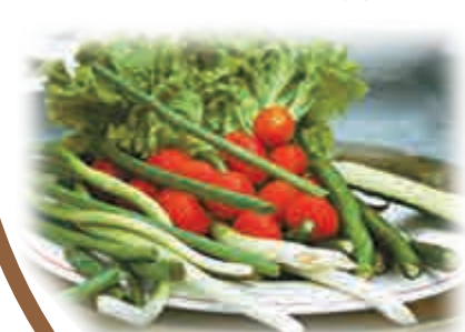
▲天然的生菜、黃瓜、青椒和大葱，配上豆瓣醬，讓人有種回歸自然的感覺

【大公報訊】實習記者鄭雲風北京報道：與印象中的中國農村不同，密雲華潤希望小鎮給人一種明亮乾淨的感覺。在溫室大柵裡，我們享用了一頓美味的農家菜，與行程中其他午餐相比，這裡少了一絲城市味，多了一份田園風光。