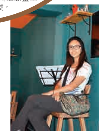
▲學生坐在鄉村酒吧感受寧靜且自然的時光