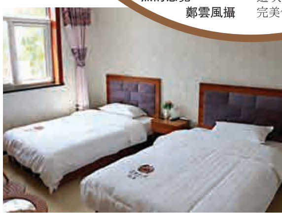
▲乾淨整潔的民宿頗受遊客歡迎

讓我印象最深刻的，要數「豐收菜」，簡單的生菜、黃瓜、青椒和大葱，配上豆瓣醬，讓我有種回歸自然的感覺，純樸的午餐也為這次田園之旅畫上完美句號。