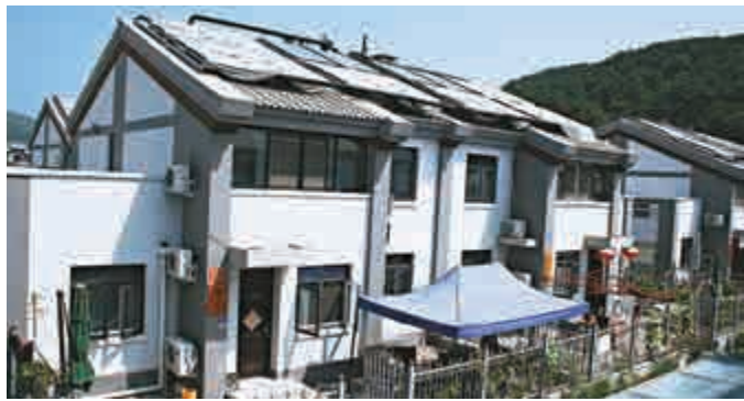
閣老峪村村民住上了現代化的鄉村別墅群

2008年至今，華潤已在廣西百色、河北西柏坡、湖南韶山、福建古田、海南萬寧、北京密雲、貴州遵義、安徽金寨建成希望小鎮，江西井冈山、福建寧德、寧夏海原華潤希望小鎮已列入建設規劃。密雲華潤希望小鎮二期也在規劃當中。